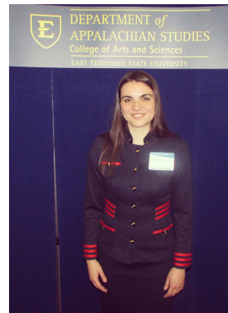
«MANY MOUNTAINS, MANY MUSICS». Секція «Музика Карпатських гір»