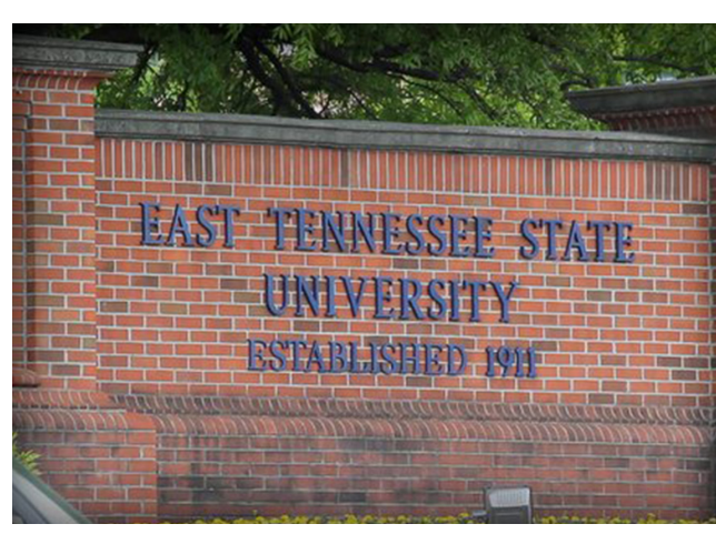
Знайомство учасників конференції з України з Державним університетом Східного Теннесі