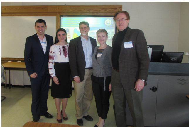
Учасники українсько-американської секції конференції