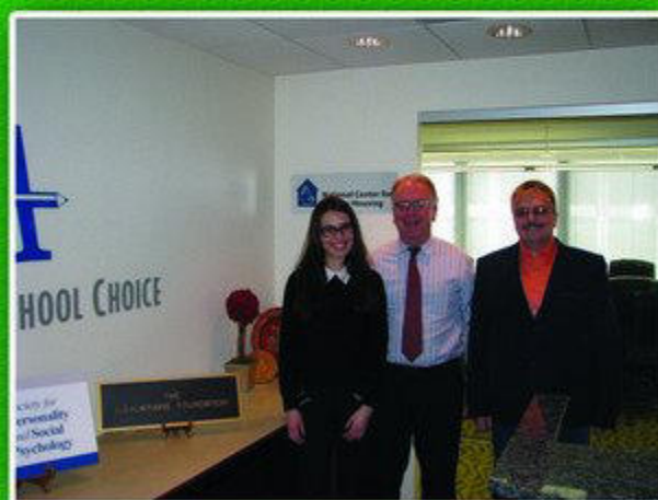
Зустріч українських науковців з віце-президентом US-Ukraine Foundation Джоном Куном