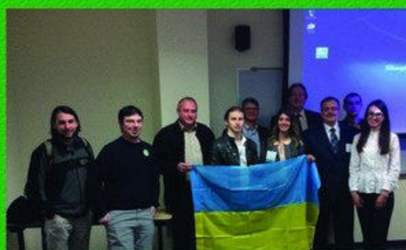
Презентація українською делегацією наукових проектів Прикарпатського національного університету імені Василя Стефаника за результатами порівняльних досліджень гір Аппалач і Українських Карпат