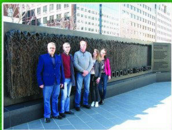
Вшанування пам'яті жертв голодомору в Україні 1932-1933 р.р. (м. Вашингтон, США)