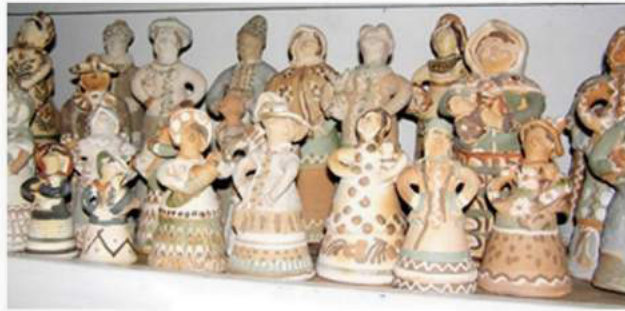
Селюченко О. Панянки. Опішня, Полтавщина, (музей О. Селюченко), 2004