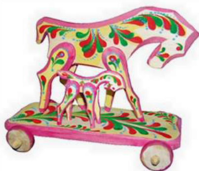
Тлустий С. Коники. Івано-Франкове, дерево, розпис, 2004