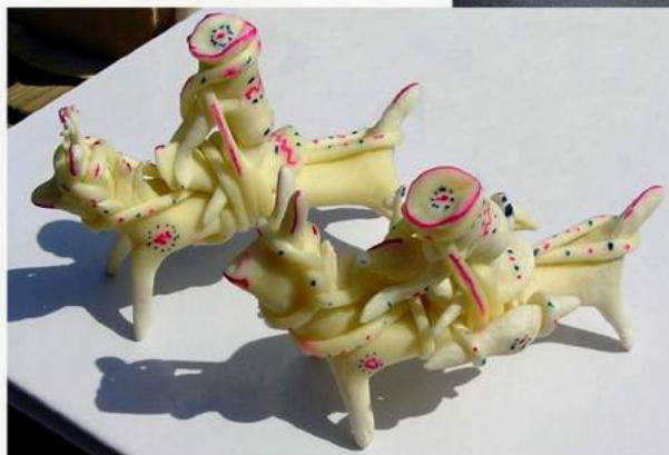
Петрів М. Вершники з сиру. Брустури, Гуцульщина, 2006