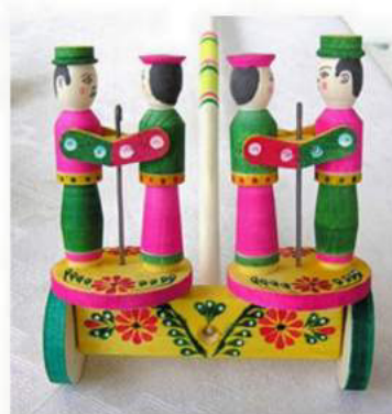
Логин В. Танцюристи. Яворів, Львівщина, дерево, розпис, 2002