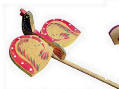
Прийма В. Пташка. Яворів, Львівщина, дерево, розпис, 1980