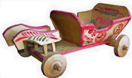
Прийма В. Коник. Яворів, Львівщина, дерево, розпис, 1980