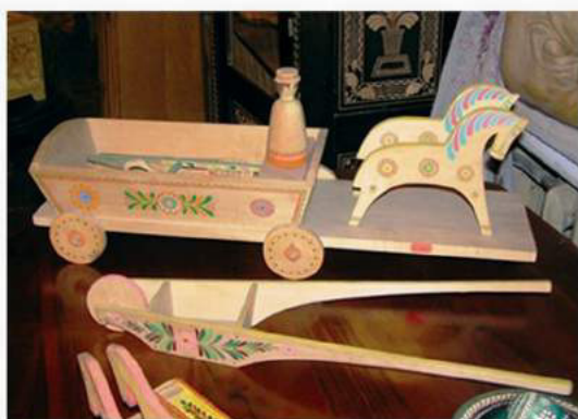
Кавас К. Підвода і тачка. Івано-Франкове, Львівщина, дерево, розпис, 1982