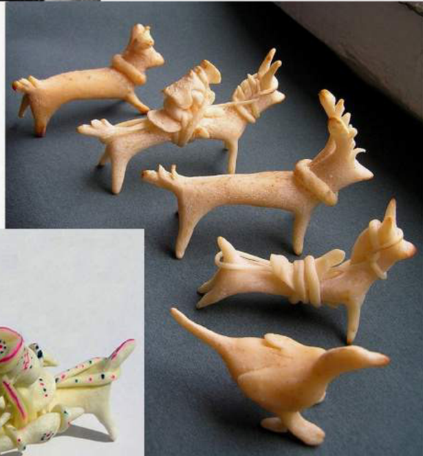
Матійчук М. Іграшки з сиру. Брустури, Гуцульщина, 1998