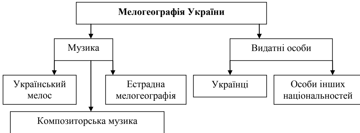
Рис. 1. Структура мело географії

Мелогографія українського мелосу (музично-поетичні форми) вивчає географію поширення різних типів музики, їх прояв в умовах сучасності.