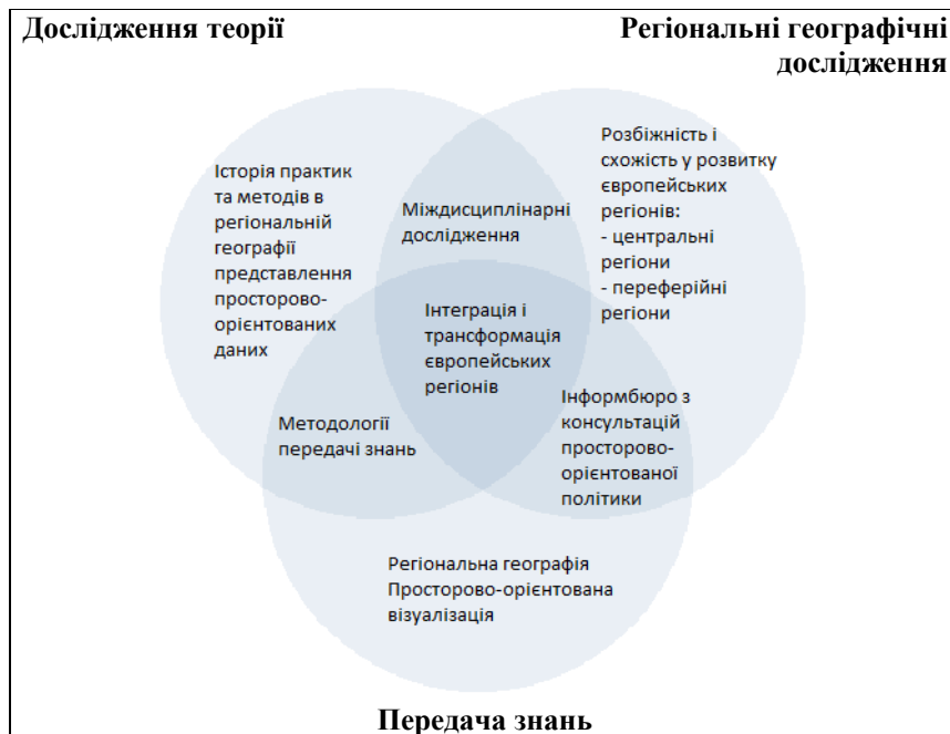
Рис. 3 Схема країнознавчих досліджень Інституту країнознавства в м. Лейпциг (IfL) [2]

Дослідження теорії в IfL включають історію цієї дисципліни, з метою виявлення традиції дискурсу і проаналізувати їх значення для дослідження і розвитку теорії сьогодні. Проекти тісно пов'язані з емпіричними дослідженнями Інституту в області «Регіональних географічних досліджень» та «Передачі знань».