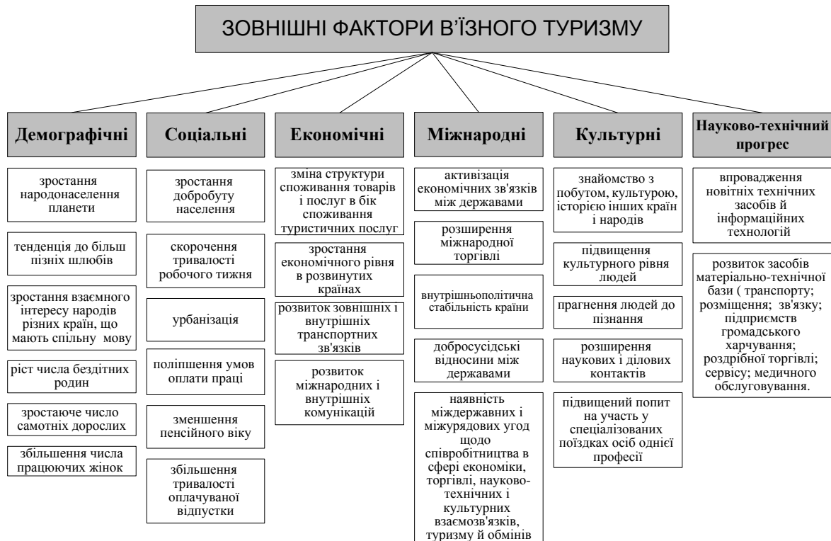
Рис.1. Зовнішні фактори в'їзного туризму

Під внутрішніми факторами в'їзного туризму слід розуміти такі суттєві причини, обставини і умови, що зумовлюють вибір іноземного туриста до подорожі саме до конкретної країни в'їзного туризму.