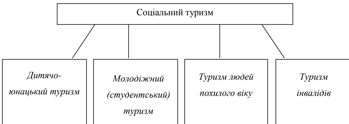
Рис.1.Класифікація соціального туризму за соціально-віковою ознакою

Дана концепція реалізована на практиці у багатьох високорозвинених країнах світу, а саме в Швейцарії, Німеччині, Франції з використанням так званих відпускних чеків. В Російській Федерації до Державної Думи вже внесений і активно обговорюється законопроект «Про соціальний туризм». У нашій же державі до розуміння необхідності розвитку соціального туризму ще тільки підходять. І завдання науковців активно піднімати це питання і довести його до найвищого законодавчого рівня.