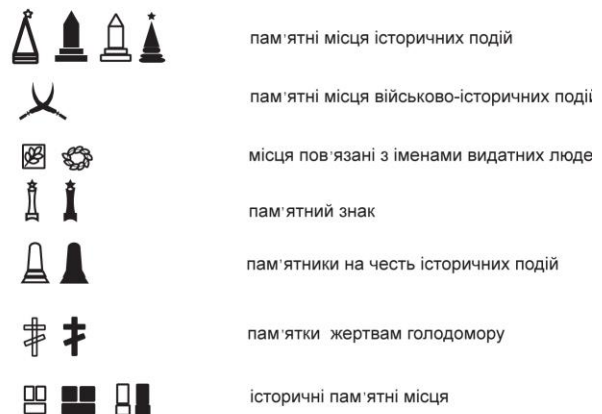
Рис.2 Фрагмент таблиці «Умовні позначення об'єктів історико-культурної спадщини для туристичних карт»

Не менш важливим є використання кольору, якщо це поліграфічне видання карт це - багатокольоровий друк. Колір один із основних зображувальних засобів, який має різнобічні можливості при побудові системи знаків та необмежені можливості для конструювання значкових, лінійних і площинних знаків. Кольорова гама в більшості знаків, чорно-біла, є знаки контурні – де лише присутня контурна частина, і є знаки з