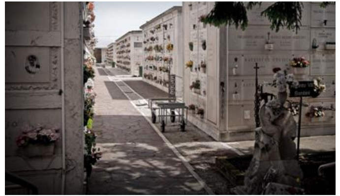
Рис. 2. Колумбарій на о. Сан-Мікеле

Дійсно, в шерензі світових некрополів (Пер-Лашез, Батіньоль, Монмартр, Сен-Женев'єв-де-Буа – у Франції, Хайгетський – у Великій Британії, Піскарьовський, Волковий – у Санкт-Петербурзі та Новодівочий, Ваганьківський, Кунцівський – у Москві (Росія), Веселий – у Румунії, Личаківський – у Львові, Лук'янівський, Байковий, Військовий, Аскольдова могила, Звіринський – у Києві, Комунарів – у Севастополі, Полікурівський – у Ялті (Україна)) Сан-Мікеле креативною географічністю та культурно-історичністю займає особливе місце. Сан-Мікеле, який ще називають «Островом мертвих» (єдине кладовище Венеції), лежить на північному сході від Венеції, на півдорозі від неї до острова Мурано (його відокремлює від Венеції близько півкілометра). На кладовищі три відділи: католицький, православний і протестантський. Спочатку під кладовище були виділені два сусідніх острова Сан-Кристофоро і Сан-Мікеле. В туристський сезон Венеціанську лагуну перетинають тисячі людей, щоб вклонитися пам'яті великих діячів мистецтва і літератури. Перш за все це композитор Ігор Стравінський (рис.6), організатор «Російських сезонів» у Парижі Сергій Дягілев і поет Йосип Бродський. Поява цих імен на могильних плитах знаменитого венеціанського кладовища не випадкова. Всі вони, залишаючи свою країну, ставали «громадянами світу», в якому б місці вони не знаходили притулок.