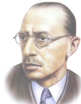
Рис. 6. І.Ф. Стравінський

Йосип Олександрович Бродський (1940-1996) похований на протестантському цвинтарі (Re parto Evangelico), його могила - ще одне місце паломництва російських туристів (рис. 7, 8).