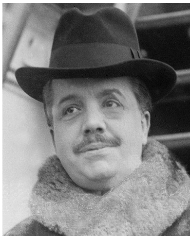
Рис. 3. С.П. Дягілев

Сергій Павлович Дягілев (1872-1929) — російський театральний і художній діяч, антрепренер, один із основоположників групи «Світ Мистецтва», організатор «Російських сезонів» у Парижі й трупи «Російський балет Дягілева» похований біля дальньої стіни (рис. 3, 4). Кажуть, ще в юності циганка передбачила йому смерть на воді. З тих пір Сергій Павлович побоювався будь-яких водних просторів. Але Венецію любив і саме тут несподівано помер в 1929 р., коли йому було всього 57 років. Свого часу Йосип Бродський назвав Дягілева «Громадянином Пермі». Могила Дягілева театральна, як і його земне життя. Замість надгробка — подоба макета маленької сцени.