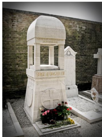
Рис. 4. Могила С.П. Дягілева

Ігор Федорович Стравінський (1882-1971) і його дружина Віра Аркадіївна Стравінська, уроджена де Боссе (1889-1982) поховані поруч (рис. 5). Коли Стравінський написав «Весну священну», у Дягілева не було грошей, щоб за неї заплатити. Після скандалу вони посварилися, але в заповіті Стравінський написав: «Прошу поховати мене в ногах у Дягілева». Прохання композитора виконали не буквально, але їх розділяє зовсім коротка дистанція на православній ділянці кладовища. Поруч спочиває вдова композитора Віра Стравінська, котра пережила чоловіка на 11 років. Але якщо прах подружжя був перевезений з Нью-Йорка, то Дягілева поховали саме в місті, де зупинилося його серце. Ігор Стравінський — композитор, диригент. Народився в 1882 р. в Оранієнбаумі поблизу Санкт-Петербурга, в сім'ї оперного співака Маріїнського театру Ф.І.Стравінського. З дитячих років вчився грі на фортепіано у А.П.Снеткової і Л.А.Кашперової. У 1903 – 1905 рр. брав уроки композиції у М.А.Римського-Корсакова, якого називав своїм духовним батьком. Під його впливом і звернувся до російського музичного фольклору, до ритуальних і обрядових образів, до балагану, лубка. У 1900 – 1905 рр. навчався на юридичному факультеті Петербурзького університету. Його