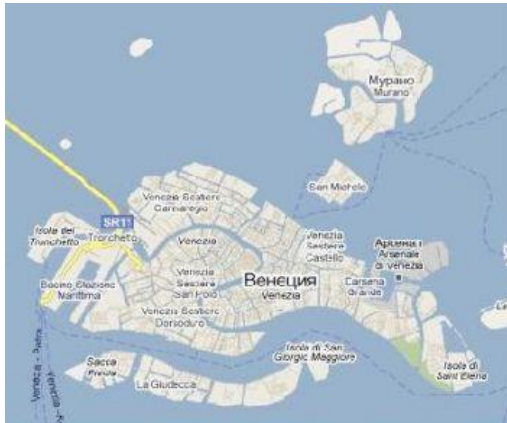
Рис. 1. Венеція та прилеглі острови Венеціанської затоки

Виклад основного матеріалу. Сан-Мікеле (іт. Isola di San Michele) — острів Святого Михайла Архангела у Венеції (Італія), острів-кладовище, острів-монастир, дорогий серцю багатьох куточок Венеції (рис.1,2).