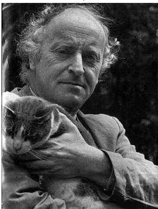
Рис. 7. Й.О. Бродський

Йосип Олександрович Бродський (1940-1996) похований на протестантському цвинтарі (Re parto Evangelico), його могила - ще одне місце паломництва російських туристів (рис. 7, 8).