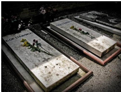
Рис. 5. Могили І.Ф. Стравінського та В.А. Стравінської

Перший у світі музей Ігоря Стравінського відкритий на Україні в місті Устилуг (Волинь) у 1990 р. Музичний фестиваль імені Ігоря Стравінського почали проводити на Волині з 1994 р. 12 червня 2010 р. в Луцьку (Волинська обл.) відкрився вже VII Міжнародний фестиваль «Стравінський і Україна».