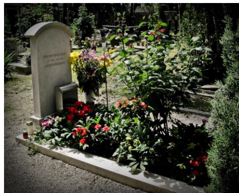
Рис. 8. Могила Й.О. Бродського