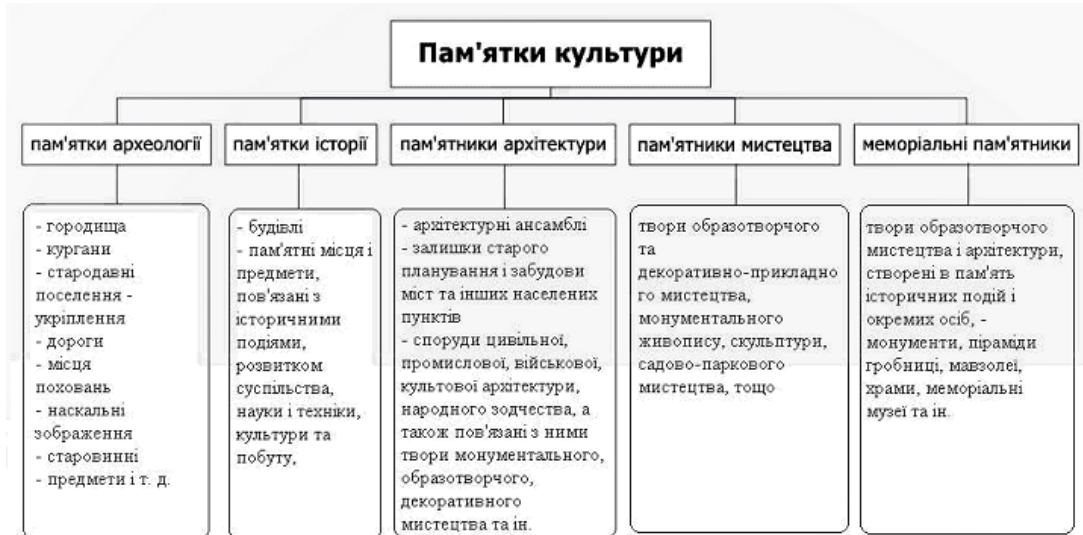
Таблиця 1. Пам'ятки культури можуть бути розділені на п'ять груп [1]

На заході від Харкова розташовані дворянські садиби минулих сторіч – справжні шедеври архітектури, які оточені розкішними парками [4]. Однак, внаслідок нестачі коштів на фінансування, садиби знаходяться у поганому стані, тому їх відвідування не має масового характеру. Достатньо відвідати тільки дві: Натальївка та Шарівка, оскільки вони знаходяться у найбільш прийнятному стані та їх місцезнаходження цьому не дуже сприяє, це представлено на рис. 1.