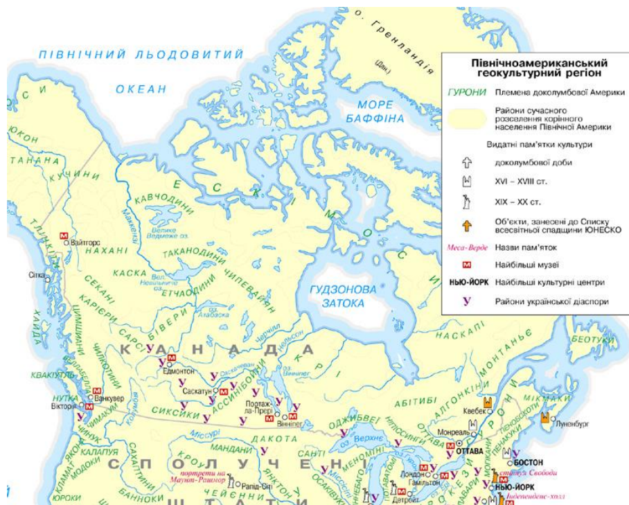
Рис. 4. Фрагмент карти Північноамериканського геокультурного регіону Карта Латиноамериканського геокультурного регіону. Масштаб близький до 1:45 000 000. Карта територіально охоплює

Карта Північноамериканського геокультурного регіону (Рис.4). Масштаб близький до 1 : 35 000 000. Карта охоплює територію США і Канади. Для країн Америки є характерною різка межа між традиційною культурою корінного населення і сучасною культурою нащадків європейських переселенців. Місця розселення давніх племен позначено підписами, сучасних індіанців – кольоровими ареалами. З карти видно, що вони витиснуті на північну периферію континенту. Значки видатних пам'яток культури поділяються на: доколумбової доби (тотем північно-західних індіанців), колоніальної доби (XVI – XVIII ст., християнський собор), сучасні (XIX – XX ст., пам'ятник Свободи). Регіон бідний на стародавні пам'ятки позаяк північноамериканські індіанці до відкриття Америки перебували на доволі низькому рівні розвитку. Натомість США і Канада входять до числа найрозвинутіших країн світу. Зміст карти включає найбільші культурні центри і музеї світового рівня. Літерами «У» позначено райони розселення українців, які внесли свою барву до культурної палітри Північної Америки.