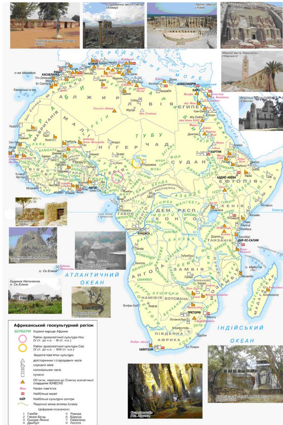
Рис.3. Карта Африканського геокультурного регіону

Класифікація умовних позначень на цій карті має особливості: пам'ятки доісторичних і стародавніх часів об'єднано в один значок через нерівномірність появи цивілізацій у різних частинах континенту (IV тис. до н.е. у Єгипті та у XVIII – XIX ст. в деяких районах Центральної Африки). Значок нагадує єгипетську піраміду. Середньовічні пам'ятки представлені значком у вигляді глинобитної західносуданської мечеті; пам'ятки колоніальних часів – католицьким собором, що їх багато залишилося на узбережжі, де колись панували французи і португальці.