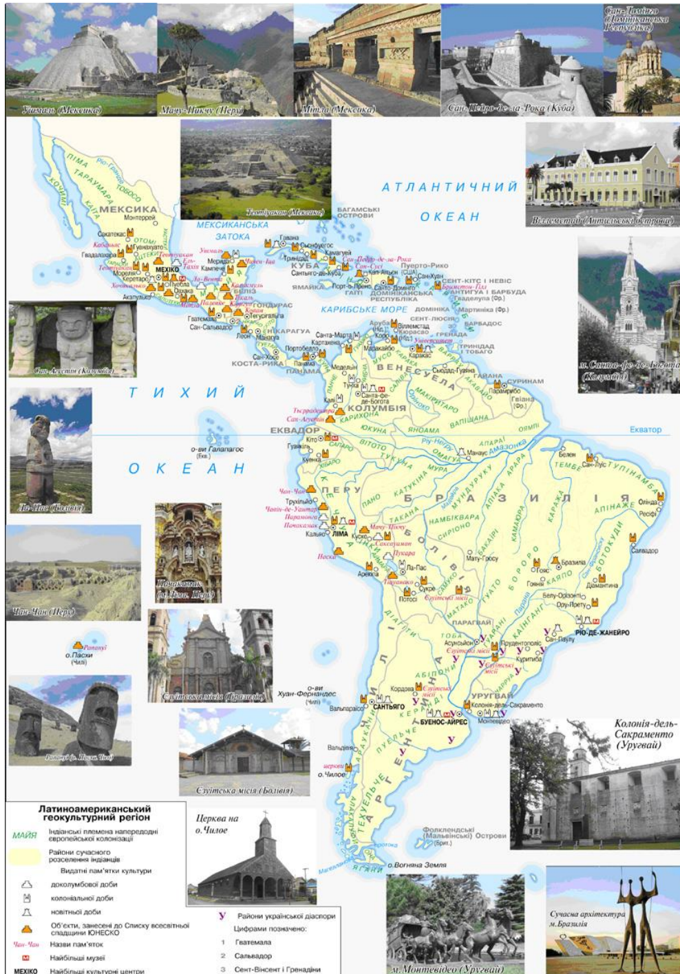
Рис.5. Карта Латиноамериканського геокультурного регіону

Південноамериканський континент, Центральну Америку з Мексикою і Вест-Індію (Рис.5). Давні індіанці цього регіону залишили по собі унікальну культурну спадщину – рештки цивілізацій майя, ацтеків, інків та їхніх попередників, які не на багато молодші за Єгипет і Месопотамію. Значок-символ ступінчатої піраміди майя на карті синтезує всі пам'ятки доколумбової Америки. Культурне обличчя колоніальної Америки формувався під впливом католицької церкви – значки, що показують пам'ятки тієї доби, мають вигляд класичного собору. Пам'ятки новітньої доби – собору модерної архітектури в сучасному місті Бразиліа.