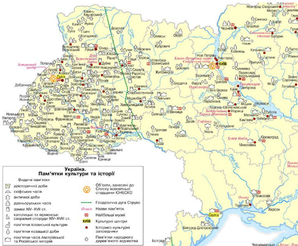
Рис. 8. Фрагмент карти пам'яток історії та культури України

(Крим) феодалами. Ці об'єкти показано характерним значком-замком. Помітним сектором архітектурної спадщини України є католицькі (виконані або перебудовані в стилістиці європейського Ренесансу) і вірменські сакральні споруди, більша частина яких так само сконцентрована на Заході, на територіях, що колись належали Польському королівству. Цю групу пам'яток символізує значок-костел.