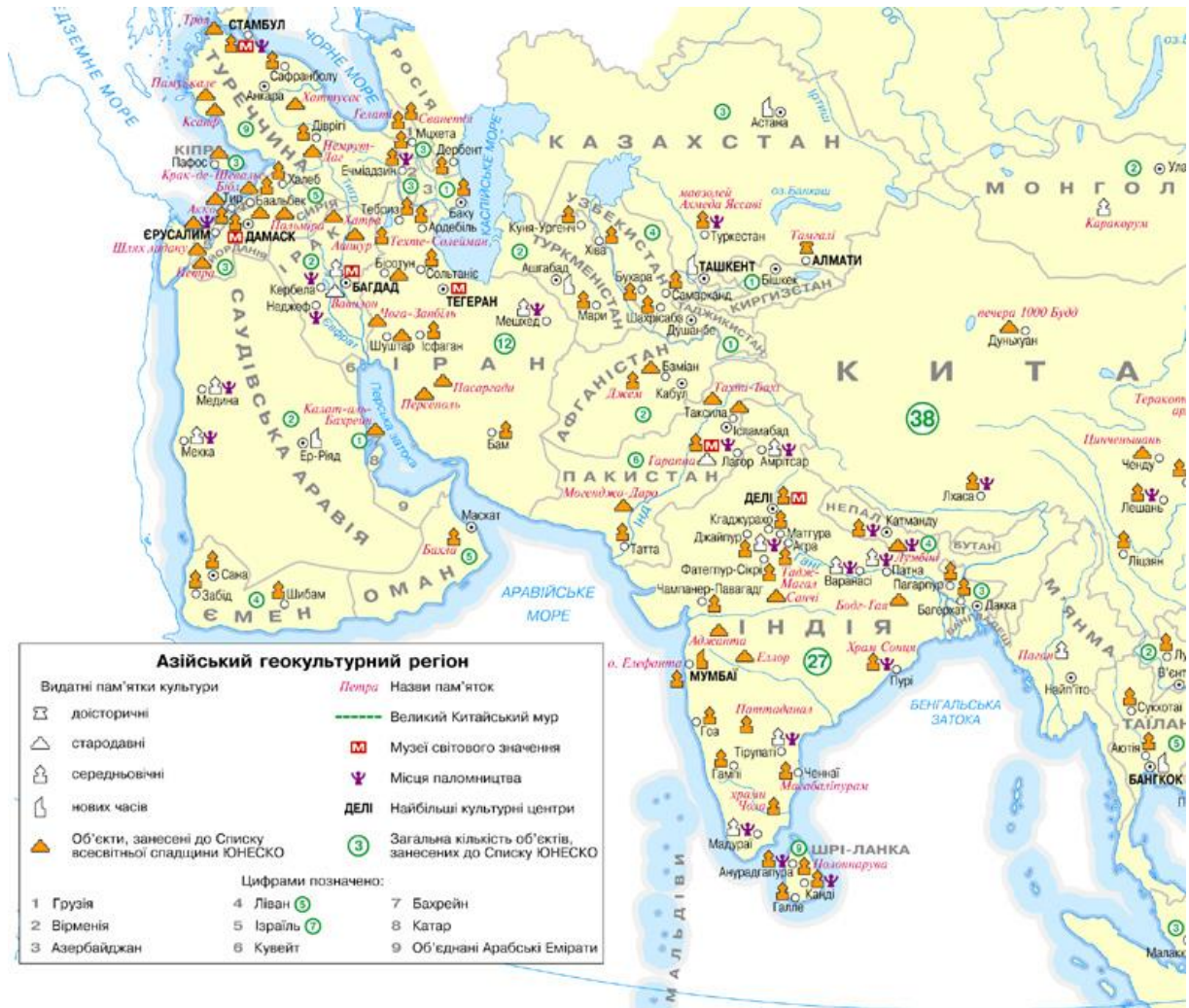
Рис.2. Фрагмент карти Азійського геокультурного регіону

викликати асоціацію з давньоіндійською храмовою ступою); середньовічний (в азійському варіанті вона охоплює і колоніальні часи – до початку XIX ст.; значок є узагальненим образом східного храму) і новий (контур сучасних будівель Сінгапура або Сянгану).