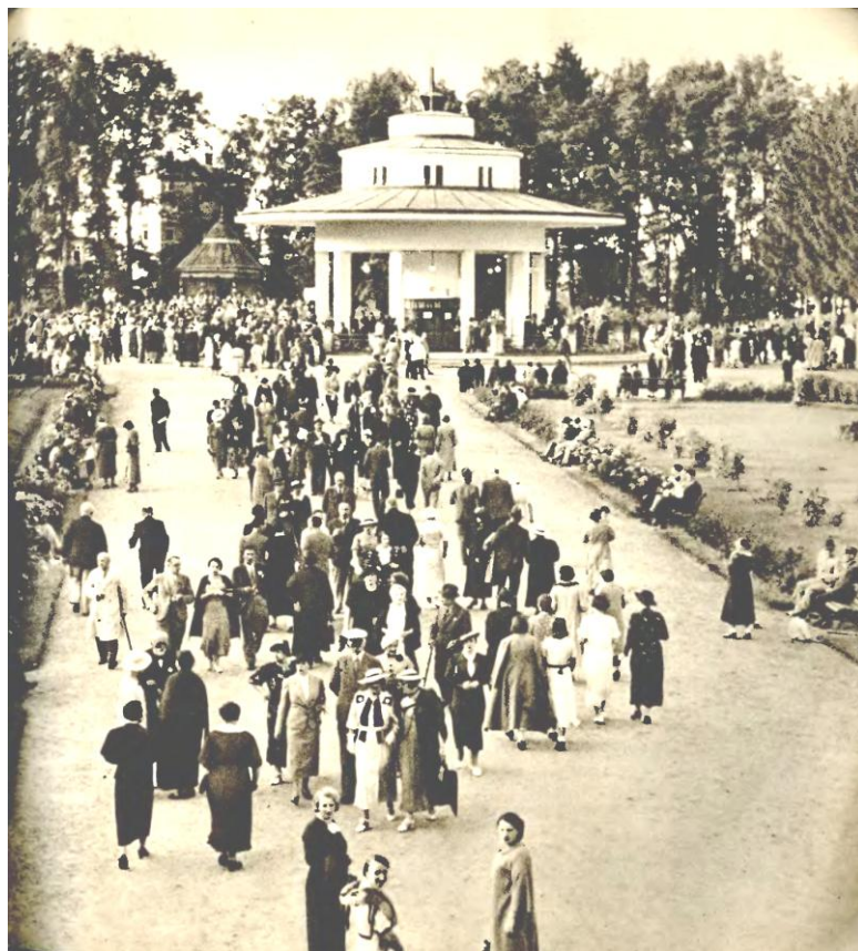
Рис. 2. Головний бювет та центральна частина курортного парку у розпал сезону 1937 року [3].

Консультував й опікувався хворими закладовий лікар Фрідріх Дзиковський.