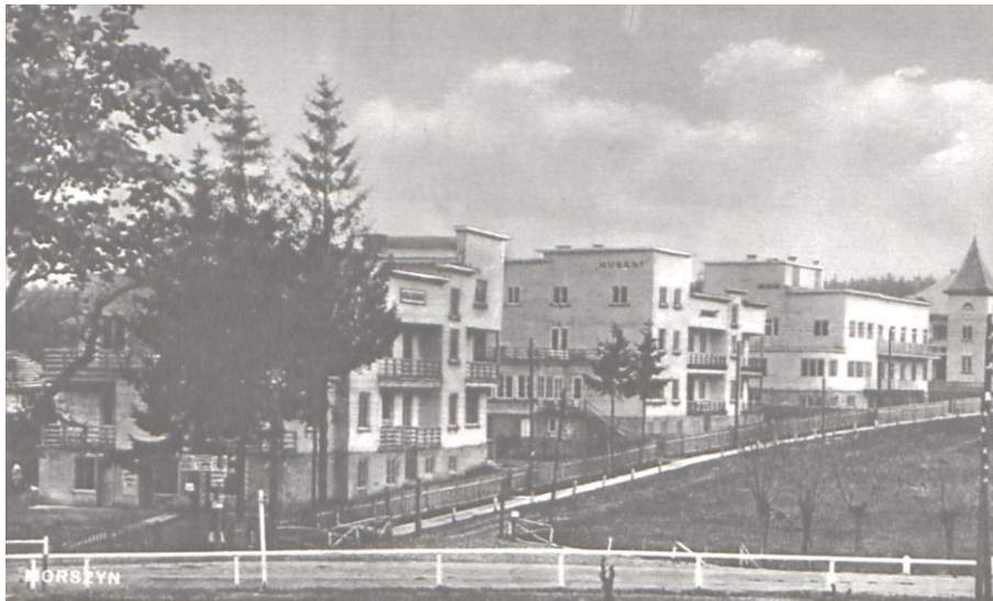
Рис. 3. Вигляд на курортну інфраструктуру Моршина у 1935 р. [3]

Невимушену дозвіллево-розважальну атмосферу моршинського курорту забезпечували: двічі на день концерти класичної музики, вечірні концерти, літературні вечори та танці і бали у великій залі головного курортного закладу, мала зала з віденським фортепіано для самостійного музичного дозвілля гостей, поле для гри у крокет і теніс, футбольне поле з низкою гімнастичних снарядів, боулінг-клуб в парку біля лісу, зручні дубові лавочки і гамаки для усамітнення гостей в курортному парку та велика гойдалка в лісі для молоді, екскурсії в Карпати, до Гошівського монастиря, Скель Довбуша біля с. Бубнища тощо.