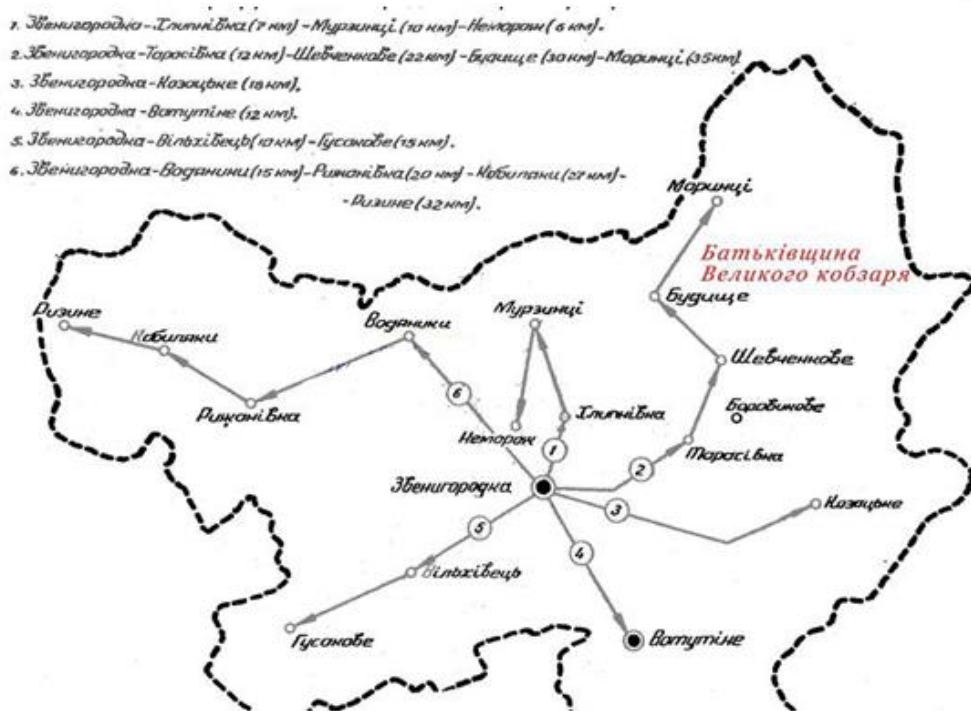
Рис. 1. Кратосхема ТП-маршрутів Звенигородського району Черкаської області

Тривалість реалізації більшості ТП-маршрутів в межах Черкаської області – 1-2 дні. Маршрути – переважно автобусні й охоплюють лише Правобережну Черкащину. Водночас, потенційною для розвитку є й Лівобережна частина області: місце народження Чемпіона Чемпіонів Івана Піддубного, урочище Бурти, Сулинський заказник (рис.1).