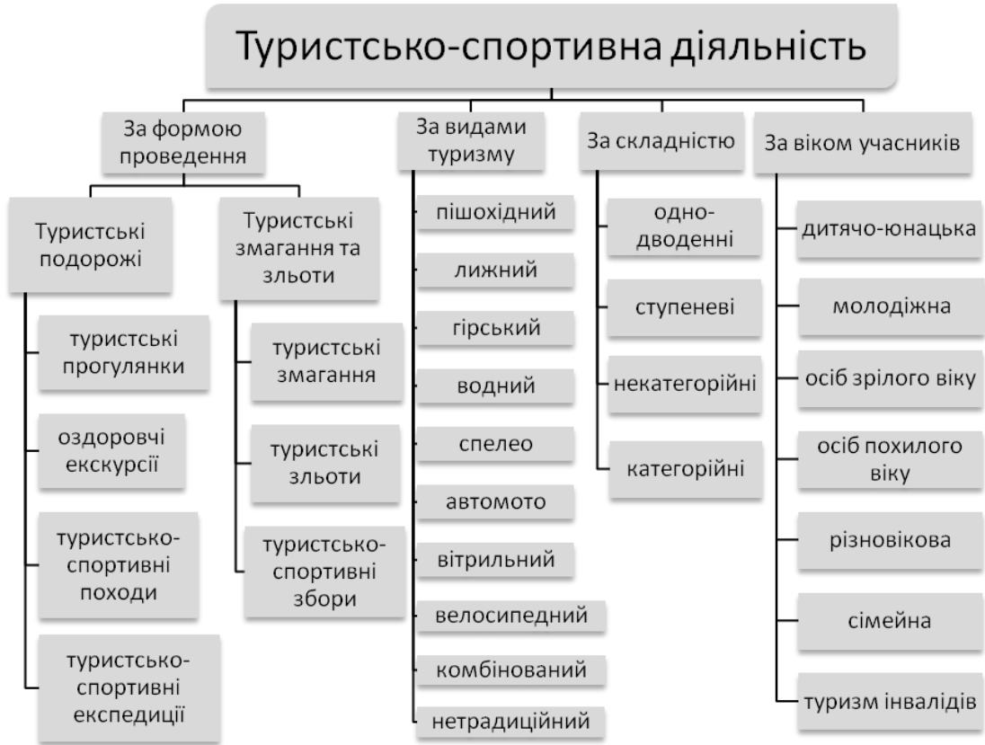
Рис.1. Класифікація туристсько-спортивної діяльності

званнями та спортивними розрядами – від масових юнацьких розрядів до звання «Майстер спорту». Спортивний туризм у економічно розвинених країнах світу розвивається на аматорському рівні і виступає як вид активної, часто екстремальної, рекреації. Класифікація туристсько-спортивної діяльності представлена на рис.1.