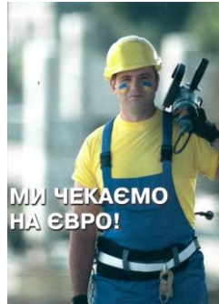
Рис. 3. Рекламний плакат «Ми чекаємо на ЄВРО»

Експерти проведення промокомпанії до ЄВРО-2012 оцінюють позитивно, однак при цьому не забувають нагадати про негативний по відношенню до України інформаційний контекст, на тлі якого з'являється принадні проморолики.