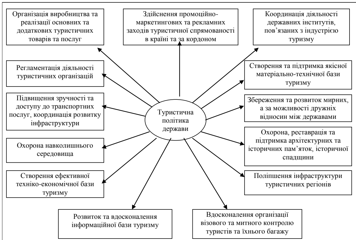
Рис. 1. Вплив туристичної політики держави на сфери суспільних інтересів (авторська розробка)