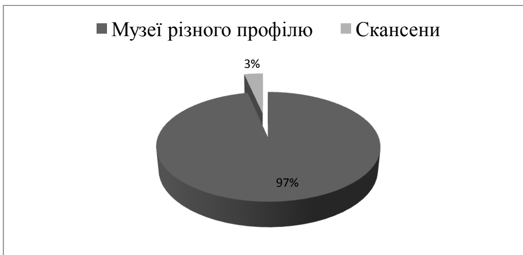
Рис. 1. Частка скансенів серед музейних закладів України

В Україні музеї-скансени займають невелику нішу серед музейних закладів нашої країни – всього 3% від загальної кількості музеїв країни (рис. 1).