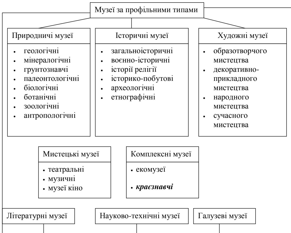
Рис.1 Краєзнавчі музеї в класифікації музеїв за профільними типами (складено за [2])

Характерними особливостями краєзнавчих музеїв, що вирізняють їх з-поміж інших музейних установ, є те, що вони, по-перше, експонують матеріальні пам'ятки і свідoctва, зібрані на порівняно невеликій території, і репрезентують її краєзнавчу спадщину; по-друге, такі музеї можуть мати доволі широку експозиційну палітру, тобто за змістом експонованих об'єктів можуть поєднувати особливості музеїв історичного, природничого, науково-технічного, художньо-мистецького, літературного та інших профілів [3]. У зв'язку з цим краєзнавчі музеї – це музеї комплексного профілю (рис. 1).