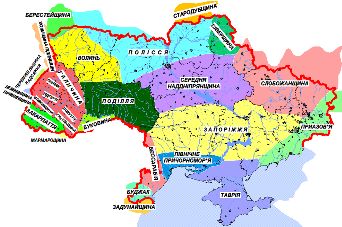
Рис. 2. Етнографічні регіони України

традицій та звичаїв. Отже, етнічний туризм є ефективним засобом збереження та відтворення людських цінностей. Це, водночас, специфічний вид людської діяльності, мотивацією якого є пізнання краєзнавчих та країнознавчих ресурсів, ознайомлення із цінностями етнографічних груп населення у місцях їх компактного проживання на території держави. Мета етнічного туризму полягає у відвідуванні будь-якого етнотуристичного регіону держави для ознайомлення із культурою, побутом, традиціями, діалектами, стравами, образотворчим мистецтвом місцевих жителів. Так, впродовж багатьох століть на українській етнічній території сформувалися різні етнографічні групи українського етносу. Серед них: лемки, долиняни, бойки, гуцули, покутяни, ополяни, подоляни, волиняни, холмщаки, підляшуки, пінчуки, поліщуки, литвини, польовики, черкаси, переяславці, полтавці, слобожанці, степовики, кубанці, донці, таврійці, причорноморці та інші т.зв. етнолокальні групи із нечітко виокремленою етнічною самосвідомістю, але зі своєрідними культурно-побутовими особливостями (рис. 2).