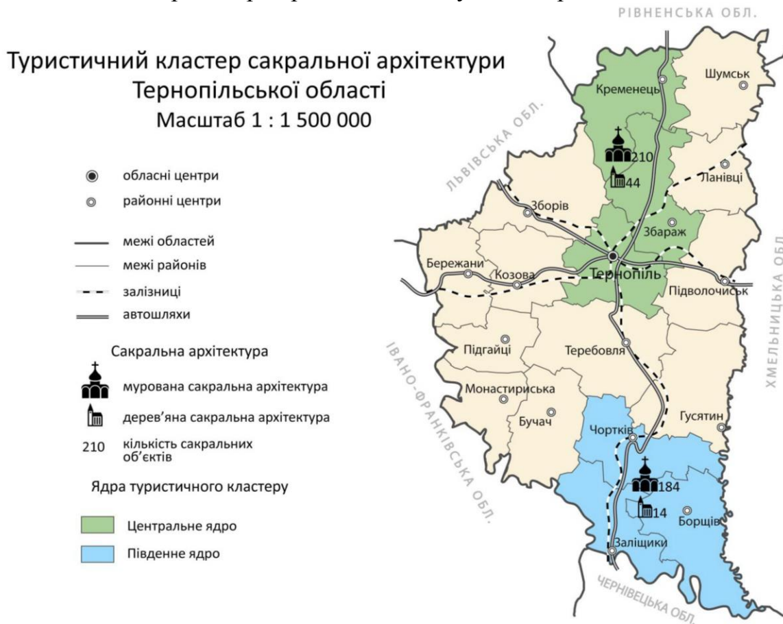
Рис 2. Туристичний кластер на базі використання сакральної архітектури Тернопільської області

розвинені банківсько-кредитні та медичні послуги (8 лікарень та 50 фельдшерсько-акушерських пунктів). Турагентську та туроператорську діяльність здійснюють близько 30 фірм. Транспортна інфраструктура центрального ядра також характеризується високим рівнем розвитку. Автомобільний транспорт представлений густою мережею автошляхів.