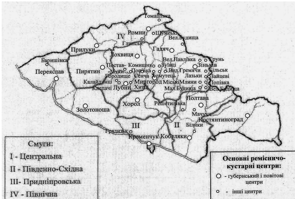
Рис. 2. Смути (райони) та основні ремісничо-кустарні центри Полтавської губернії у другій половині XIX ст.

форм виробництва та райони, де вони були поширені менше. До району їхнього найбільшого розвитку і поширення В. Василенко відносив смугу, що починалася від південно-західних придніпровських повітів, продовжувалася центральними повітами, сягаючи меж Харківської губернії.