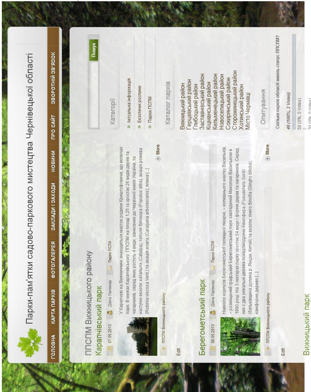
Рис. 2. Вигляд сторінки веб-сайту «Парки-пам'ятки садово-паркового мистецтва Чернівецької області»

Всебічний розвиток ППСМ Чернівецької області забезпечить ефективне рекреаційне природокористування. Шлях до удосконалення діяльності парків полягає в формуванні та реалізації програм функціонування ППСМ на різних рівнях державного управління (державна, регіональна, обласна програми розвитку, інструкції та розпорядження, програми розвитку населених пунктів та програми розвитку ППСМ, що враховуватимуть стратегічні програми розвитку вищих рівнів та специфічні характеристики конкретного ППСМ).