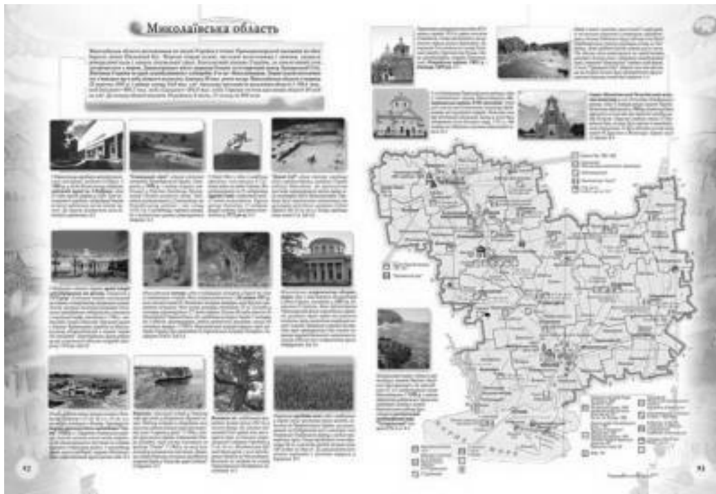
Рис. 2 Сторінка з атласу «Туристичне намисто України»

Структура атласу «Туристичне намисто України» розроблена у відповідності до прийнятого змісту і призначення атласу (табл. 1). Атлас має певні особливості, які полягають у наступному: структура атласу складається з карт, графічних побудов, аерокосмічних зображень та текстів науково-довідкового спрямування, що розміщені у прийнятій до програми атласу послідовності. Атлас не має поділу на розділи.