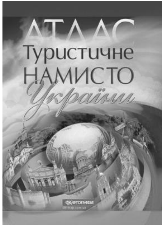
Рис. 1 Атлас «Туристичне намисто України»

Виклад основного матеріалу. Для аналізу був обраний атлас «Туристичне намисто України», за видавництвом ДНВП «Картографія», що являється довідковим середньо форматним тематичним атласом України, що відображає рівень розвитку туристичної сфери в кожному регіоні нашої країни та дає загальний огляд території (рис. 1). Для аналізу даного туристичного атласу був використаний системний підхід, за допомогою якого було виділено системи карт з відповідними їм зв'язками та співвідношеннями.