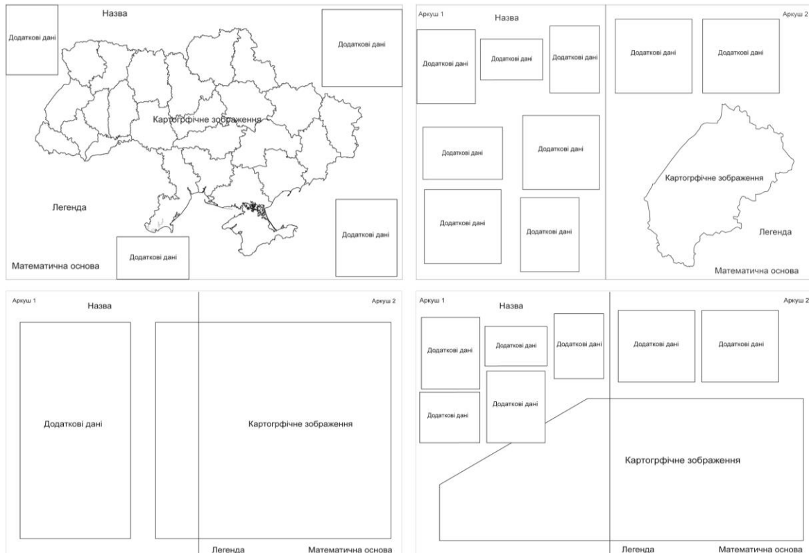
Рис. 3 Приклади типових компоновок листів карт