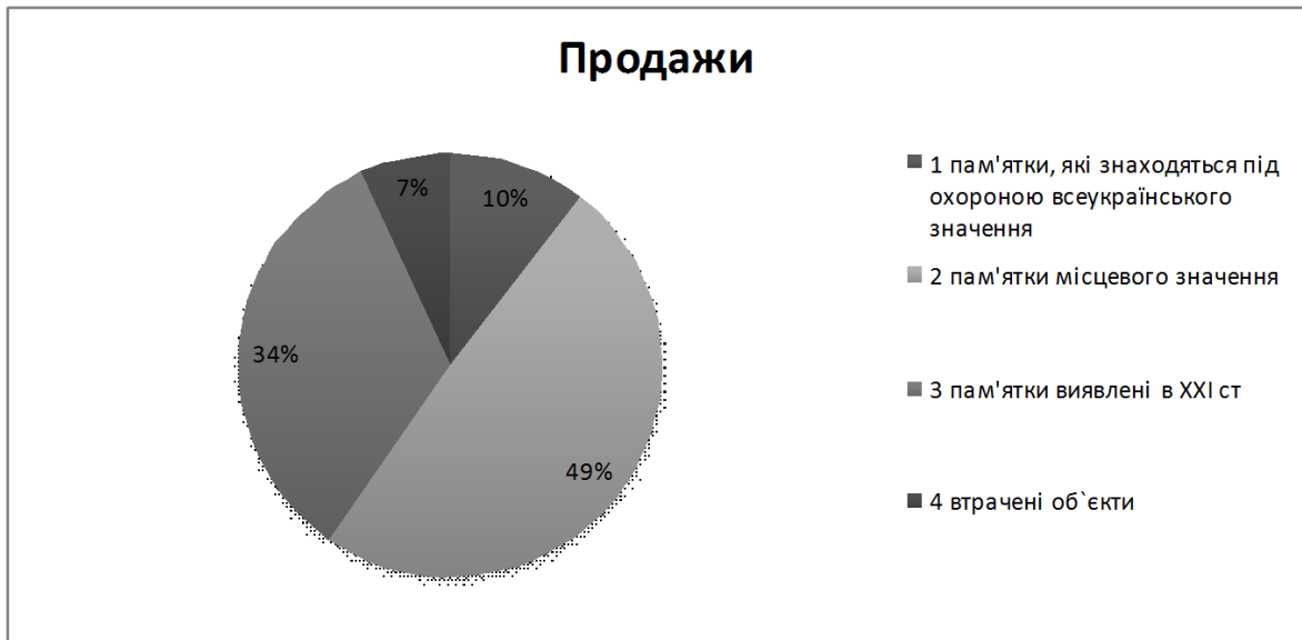
Рис. 1. Співвідношення пам'яток м. Києва

1363, втрачених пам'яток 278 об'єктів. (Рис.1) Знаючи загальну кількість пам'яток міста Києва, площу яку вони займають та кількість втрачених пам'яток, ми знаходимо відсоток від площі яку займають втрачені пам'ятки від площі яку займають всі пам'ятки. Цей відсоток становить 4,7. Даний відсоток може здатися не значним, якщо не брати до уваги що з кожним роком він зростає.[6]