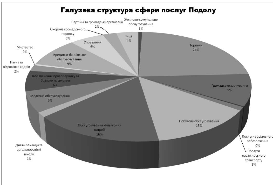
Рис. 1. Галузева структура сфери послуг Подолу

Проведені дослідження показали, що на Подолі домінують послуги торгівлі (23,6%), обслуговування культурних потреб (15,8%), побутового обслуговування (12,8%), громадського харчування (9,3%) та кредитно-банківського обслуговування (9,0%). Разом вони становлять 70,5% усіх послуг Подолу (див. Рис. 1).