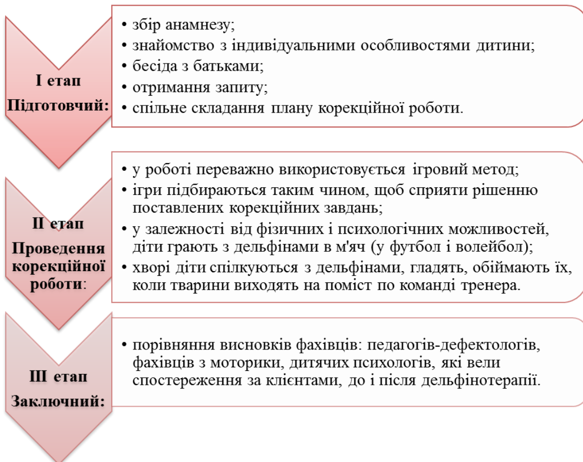
Рис. 1. Етапи курсу дельфінотерапії при готелі

Курс дельфінотерапії при готелі складається з 3 етапів (рис. 2). Він базується на ігровому контакті хворої дитини із морськими ссавцями, тому що тварини в такій ситуації проявляють свою активність тим самим дають можливість розкрити свій емоційний стан дитині із психічними вадами розвитку. Гра проходить або під наглядом психолога, або за безпосередньої його участі. Контакт з дельфінами який відбувається за допомогою ігрового стимулу дитини до фізичних вправ, спрямований на розвиток великої моторики, орієнтацію в просторі, що також підсилюється уроками з ліплення і малювання на заняттях також застосовуються різні психотерапевтичні прийоми.