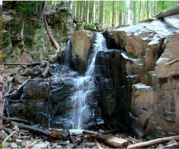
Рис. 4 Водоспад «Скакало»

Не менш цікавою принадою є водоспад «Скакало», розташований на потоці Матеків в урочищі Нижнє Грабовище за 3,5 км від с. Чинадієво, Мукачівського району (рис.4). Також рекреанти можуть відвідати такі цікаві туристичні об'єкти як палац Шенборнів, замок Паланок, водоспад Воеводин, Полонину Руну, Лумшорські водоспади тощо [1].