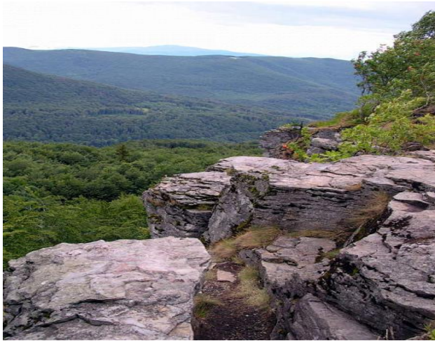
Рис.3 Обавський камінь

декілька комбінованих і пішохідних туристичних маршрутів. Серед них найбільшим туристичним попитом користується подорож на Обавський камінь. Обавський камінь – кратерна частина стародавнього вулкану площею більше 1 га, скеляста вершина якого розташована на висоті 1007 м над рівнем моря, утворена 20 млн. років тому внаслідок виверження вулкану третинного періоду (рис.3).