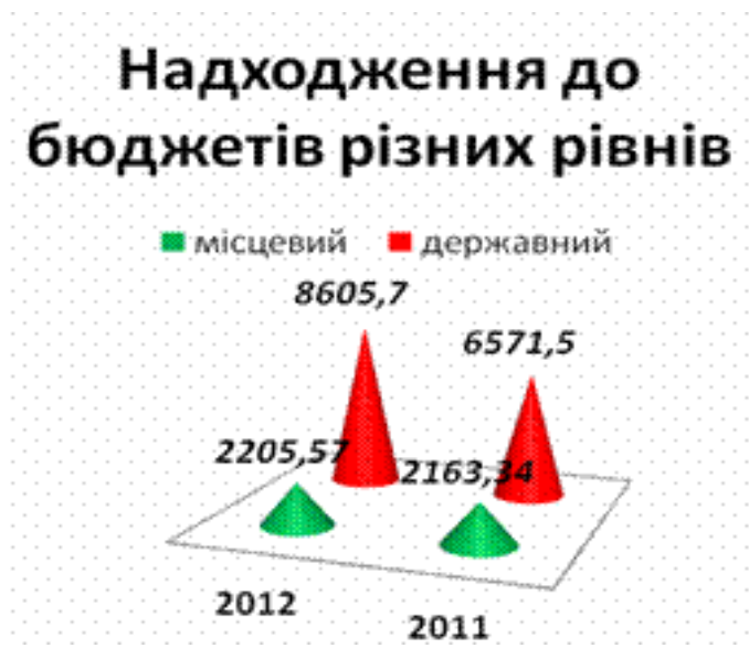
Рис.1. Діяльність закладів туристично-рекреаційної галузі Мукачівського району Закарпатської області за 2012 рік

майже 11млн.грн. Таким чином до місцевого бюджету було відраховано 2205,57 тис.грн (на 42,23 тис.грн збільшилося), а до державного бюджету відрахування зросли на 1,3% і становлять 8605,7 тис. грн. (рис.1)