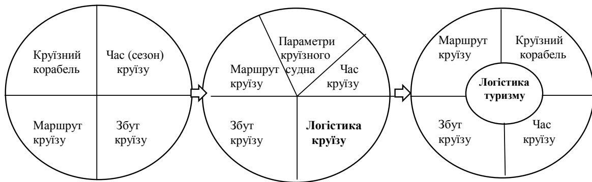
Рис. 1. Логістика круїзу як головна площина конкуренції компанії на ринку круїзних послуг

найрозкішніших круїзних лайнерів, що можуть надати найширший набір послуг на борту (включаючи кіно, казино, театр, скалодром, каток, серф-майданчик тощо) з метою задовольнити вимоги пасажирів з різними смаками та фінансовими можливостями. Конкуренція на підставі часу (сезону) круїзної подорожі полягає в диференціації круїзного продукту за сезоном року (наприклад, новорічні та різдвяні круїзи) або за часом події (приміром, Олімпійські ігри, чемпіонати світу з футболу тощо). Також круїзний сезон є одним із головних чинників, що впливають на стратегію круїзної компанії щодо ефективного використання круїзних лайнерів. Конкуренція на підставі маршруту круїзу – важливий та складний чинник, що включає тривалість круїзу, кількість відвідуваних портів, число пропонованих екскурсій тощо. Нарешті, процес продажу круїзних турів також надає конкурентні переваги тій круїзній компанії, яка швидше впроваджує сучасні комунікаційні технології, продаж через Інтернет тощо.