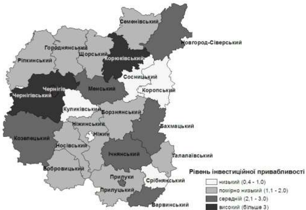
Рис. 2. Групування міст та районів Чернігівської області за особливостями інвестиційної привабливості

Безперечним лідером серед міст є Чернігів, а серед адміністративних районів – Чернігівський район, умови формування інвестиційної привабливості в яких є найкращими. За рахунок свого вигідного економіко-географічного положення та адміністративного статусу Чернігова, місто та район за багатьма показниками розвитку економіки та соціальної сфери випереджають всі інші території області. За показниками роздрібного товарообороту у розрахунку на одну особу, кількістю працездатного населення, кількістю підприємств на 10 тисяч осіб наявного населення та показниками природного скорочення м. Чернігів займає найкращі позиції серед міст обласного значення.