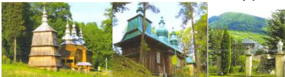
Рис. 5. Шлях ікон [5]