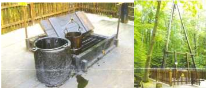
Рис. 3. Нафтовий шлях [5]

ікон» та «Шлях Папи Римського», які проходять поблизу польсько-українського кордону та пропонуються туристам в рекламних виданнях Підкарпатського воєводства Польщі, зокрема в «Туристичній мапі (південна частина воєводства)» [5]. Так, «Хасидський шлях» - це міжнародний туристичний маршрут, який проходить через містечка південно-східної частини Польщі, в яких знаходяться пам'ятки спадщини єврейської культури, зокрема це: Балігруд-Леско-Санок-Риманув-Ропчице-Денбіца-Тарнобжег-Краснік-Люблін-Ленчна-Влодава-Хелм-Замость-Білгорай-Цешанов-Вельке Очи-Ярослав-Лежайськ-Динув-Пшемишль-Устшики Дольне (рис.4).