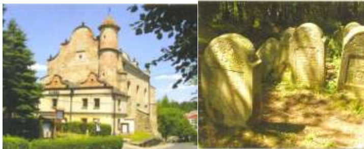
Рис. 4. Хасидський шлях[5]