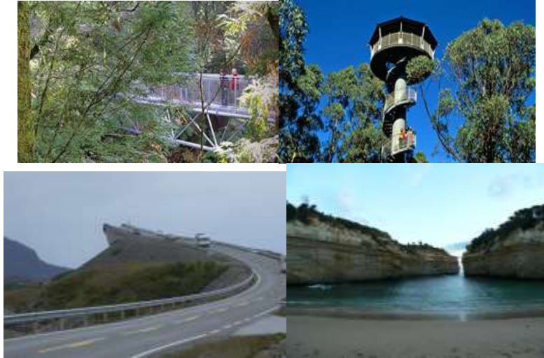
Рис. 1. Велика океанська дорога в Австралії: фрагменти [3]

10 шилінгів і 6 пенсів за вісім годин, при цьому живлення коштувало 10 шилінгів на тиждень. Ця дорога замислювалася як військовий меморіал на честь австралійців-героїв Першої світової війни, і одночасно повинна була пов'язати віддалені населені пункти узбережжя, полегшити транспортування піломатеріалів і привабити туристів (рис. 1).