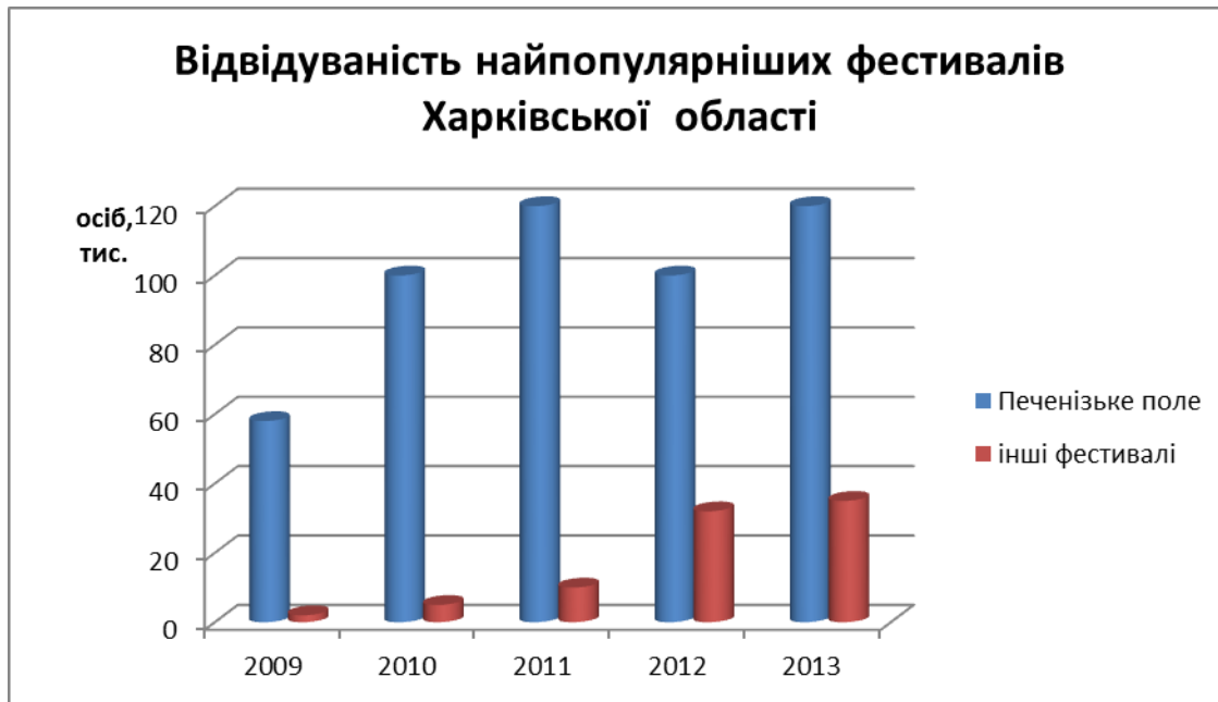
Рис. 4. Динаміка відвідування фестивалів в Харківській області [5]

Накопичений Харковом та іншими містами України досвід у проведенні подієвих заходів, у тому числі у проведенні таких мега-подій як «Євро-2012», може стати важливим підґрунтям для розвитку масштабних проектів подієвого туризму. При цьому принципово важливою основою для такого роду заходів є участь місцевого населення, позиціонування досягнень, продукції та творчих особистостей конкретного міста.