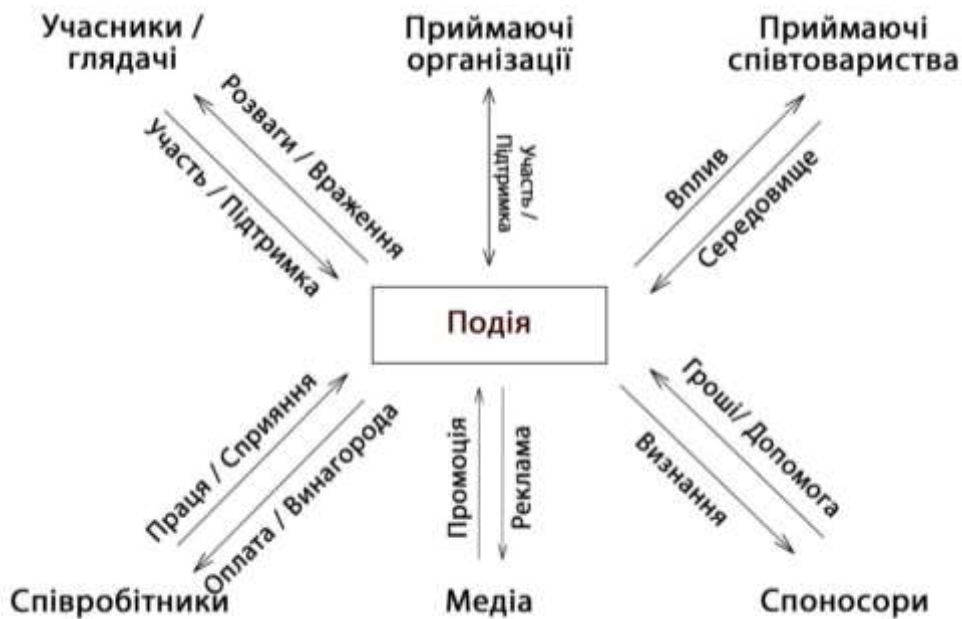
Рис. 5. Відношення зацікавлених сторін до подій (за Allen J.)