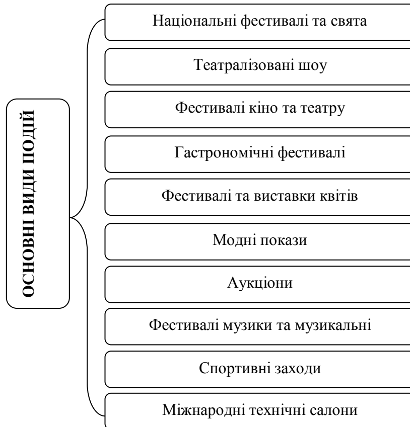
Рис. 1. Типологія основних видів подій

В Україні дослідження подієвого туризму не знайшло належно висвітлення у науковій літературі. На необхідності використання «подієвих рекреаційно-туристських ресурсів» звертав увагу Бейдик О. [2]. Подієвий туризм як історико-культурне явище розглядав Устименко Л. [6]. У публікації Давиденко І. [3] подієвий туризм висвітлений як важливий ринковий сегмент, розкрито теоретичні основи його організації.