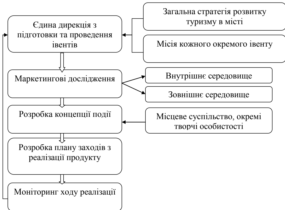
Рис. 6. Основні етапи розробки стратегії створення і реалізації продукту подієвого туризму