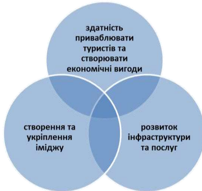
Рис. 2. Головні переваги подієвого туризму для міста

інфраструктури, економічного зростання і туристичних потоків, формування позитивного іміджу (рис. 2). Іншими словами, як відзначає Дональд Гетц, подієвий туризм спрямований на повну експлуатацію можливостей події в цілях досягнення розвитку туризму в приймаючих спільнотах [12, с. 176].