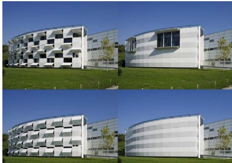
Рис. 2 Динамічна будівля із змінним фасадом

Архітектурна змінність має на увазі розгляд проектного об'єкту як складної системи, що розвивається. Розгляд архітектурних об'єктів в розвитку дозволяє спрогнозувати майбутню реконструкцію і зробити її більш дієвою. В цьому випадку проектування стає засобом моделювання не лише технічних і конструктивних, але і соціальних, екологічних, організаційних і інших систем. При цьому вони придбавають пристосовність, гнучкість, розвиток і економічність. Таким чином, в сучасній теорії і проектній практиці стійко сформувався напрям гнучкої архітектури. Структура будівлі, що має гнучкість, здатна в заданий момент часу прийти в стан, що строго відповідає цьому моменту циклу функціонування, а потім повернутися в початковий стан.