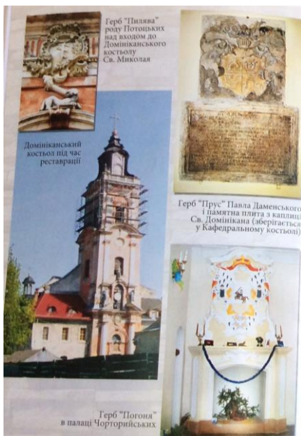
Рис. 3. Герби «Пилява» (роду Потоцьких) та Братів-домініканів

поранений у живіт, герб отримав нову назву. Нині майстерно вирізьблений з каменю герб єпископа М.Дембовського «Єліта» прикрашає західний фасад Кафедрального костелу: це три перехрещених списи. У кольорі зображувалися як золоті списи на червоному полі. Під гербом знаходиться меморіальна плита з написом латиною на честь М.Дембовського, оскільки саме він у XVIII ст. відновив костел після турецької окупації, від реставрував головний фасад у стилі бароко. Стараннями єпископа у костелі з'явилися амвон, прикрашений фігурами чотирьох євангелістів, трон єпископа, сповідальні, почесні лави. Також було встановлено позолочену статую Діви Марії на мусульманському мінареті, прибудованому турками до західного фасаду костелу у 1672 – 1699 рр. Герб «Єліта» зображено також на пам'ятній урні, що знаходиться праворуч від каплиці Пресвятих Тайн (рис.5 ).