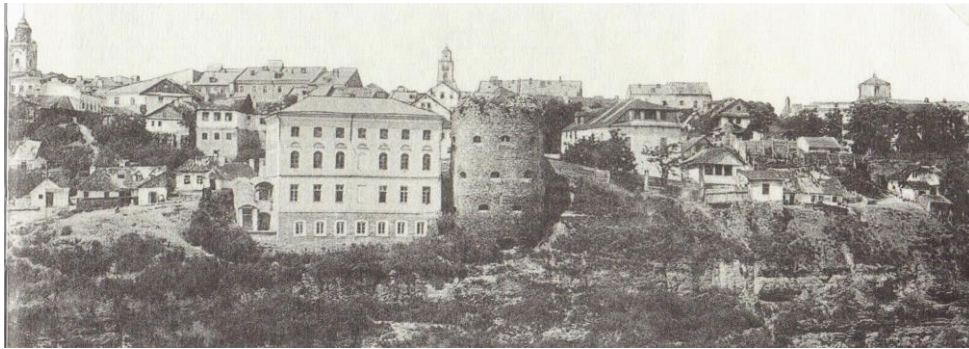
Рис. 2. Східна частина Старого міста Кам'янця (в центрі – споруди синагоги та Гончарської башти)

залишилась єврейська біднота. У ХІХ – на початку ХХ ст. єврейська громада міста проживала компактно у східній частині Кам'янця (на Східному бульварі, або тзв. Валах). Тут діяли дві синагоги та єврейська школа, а біля самісінької річки була в ті часи єврейська громадська лазня, яка до наших часів не збереглася. На Валах жили євреї-торговці, ремісники, а також візники, які мали коні та балагули – криті дорожні вози. Тож і самих візників називали балагулами. Кам'янецькі балагули перевозили пасажирів до Жванця, Старої Ушиці, Дунаївців, Проскурова, Меджибожа, Старокостянтинова, Сатанова та інших подільських міст і містечок. На Валах наприкінці ХІХ ст. було зведено чотирьохповерховий (!) будинок Кам'янець-Подільської хоральної синагоги, який примикав до середньовічної оборонної споруди – Гончарської башти (рис. 2).