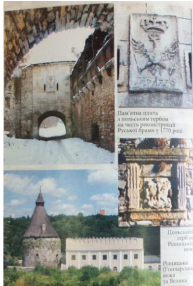
Рис. 7. Герби Королівства Польського на Руській брәмї та Різницький (Гончарській) вежі

Другий герб у символі Речі Посполитої – це герб Великого князівства Литовського «Погоня» (литовською «Вітіс»), який зображується як вершник з мечем або списом в одній руці і щитом у другій. Герб сформувався у період жорсткої боротьби литовців з Тевтонським орденом. Озброєний вершник, як захисник країни, був зрозумілий народу. Саме під знаком «Погоня» була здобута перемога 1410 р. над хрестоносцями у битві при Грюнвальді. Білий Вітіс – вершник зображувався на червоному полі. Взагалі характерні кольори польської і литовської геральдики – червоний і білий. Червоний – символ хоробрості, крові, пролитої за батьківщину, білий – чесності, цнотливості, святості.