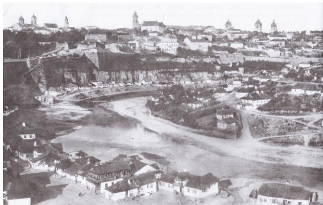
Рис. 1. Панорама Карвасар та Старого міста Кам'янця (на задньому плані)

Однією з можливостей міжнародної диверсифікації туристопотоків та виходу на нові міжнародні туристичні ринки з метою подальшого збільшення числа туристів для Кам'янця-Подільського є, наприклад, можливість задіяти єврейську спадщину міста та Поділля, зокрема, для приваблення туристів з Ізраїлю, яких за останні роки у Кам'янці не зафіксовано (на відміну від Тарнова, де вони займають п'яте місце серед іноземних відвідувачів за чисельністю). Між тим, єврейська спадщина Кам'янця-Подільського надає такі можливості, оскільки є досить обширною. У XVII-XVIII ст.(за влади Речі Посполитої) євреям не дозволялося жити в місті, їм можна було тільки входити до міста вдень на декілька годин. Це пояснювалось тим, що місто було потужним військово-фортифікаційним осередком та мало виключно важливе оборонно-прикордонне значення [8]. Тому вулиці під назвою «Єврейська» (як у Львові або у тому ж самому Тарнові) у Кам'янці немає. Єврейське населення тоді проживало у торгівельному передмісті Кам'янця під назвою «Карвасари» (викривлене караван-сарай). Воно знаходилося, за словами відомого дослідника Кам'янця та Поділля Є.Сіцинського, «біля підніжжя старого Кам'янецького замку, внизу при річці Смотрич, на вузькій прибережній смузі, що пролягла вздовж скель» [7, с.195] (рис.1)