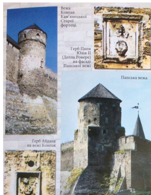
Рис. 4. Герб Папи Юлія II (Делла Ровере) на фасаді Папської вежі та герб Абданк на вежі Ковпак

У цій урні зберігається серце М.Дембовського, а тіло його було поховане у підземеллях костелу. Не менш цікаві історії для туристів пов'язані із іншими гербами, зображення яких можна бачити і сьогодні на древніх мурах Кам'яця, незважаючи на століття, що минули, та різні влади, що урядували в місті і в Україні (польська, російська, радянська). Це герби «Абданк», «Пшегоня», «Гриф», «Правдзиц», «Косцеша», «Прус», «Задора», «Кораб», «Ястшенбец», «Труби» та ще декілька не ідентифікованих. Переважна більшість гербів у пам'ятках архітектури Кам'яця-Подільського виконана із великою майстерністю. Порівняна невелика частина гербів становить лише зображення щиту і символу, більшість гербів представлено у розвиненій іконографії: вони мають корони, намети, мантії та інші декоративні елементи. Історико-туристичне