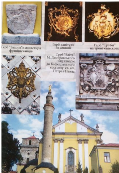
Рис. 5 Герби «Еліта», «Задора», «Труби» та герб Капітули у Кафедральному костелі св. ап. Петра і Павла Кам'янець-Подільського

Крім гербів шляхетських родин цікавим для туристів, зокрема, іноземних – передусім з Польщі та Литви буде ознайомлення з гербами Речі Посполитої (унійної держави Польщі та Литви), Королівства Польського та Великого Князівства Литовського. Цих держав вже давно немає на мапах Європи та світу, сучасні незалежні республіки Польща та Литва нині мають свої кордони далеко від Поділля, але на древніх мурах Кам'янець-Подільського і до цього часу можна побачити їхні старовинні герби. Так, з правого боку від входу до Кафедрального костелу, на невеликій відстані від підлоги, вмонтована плита з гербами Польщі (одноголовим орлом) та Литви (вершником на коні, «Погоня»). Поєднання цих гербів було символом польсько-литовської унії та нової держави – першої Речі Посполитої (від латин. Res Publica), що утворилася після Люблінської унії 1569 р. (рис. 6).