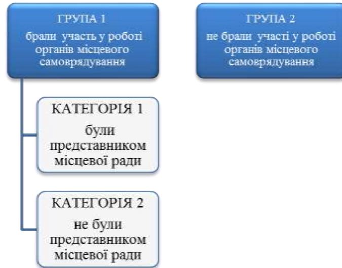
Рис.1 «Групування експертів»

персональних даних. Перший блок – це набір питань оглядового характеру, що мали на меті дізнатися загальне враження щодо реформи з децентралізації влади в Україні. Респонденти ділилися думкою на рахунок задач та принципів децентралізації, темпів впровадження реформи у реальну роботу місцевого самоврядування. Другий блок складався з питань, які в першу чергу стосуються об'єднаних територіальних громад.