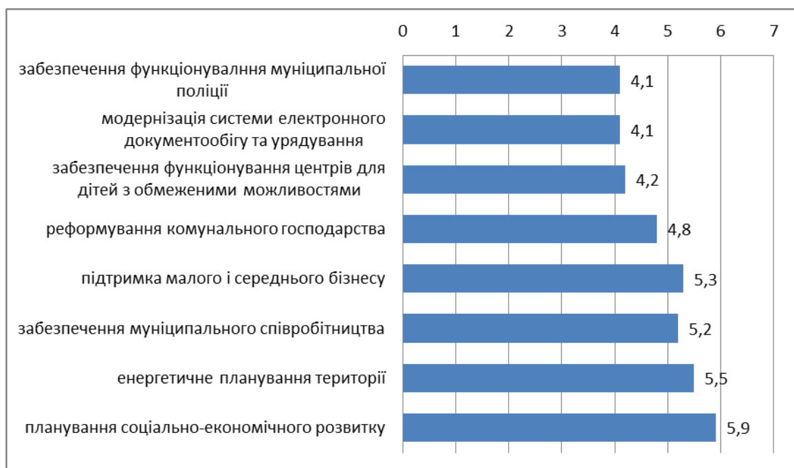
Рис.3. Розподіл пріоритетних для місцевої влади завдань

Не зважаючи на спірні позиції щодо векторів розвитку регіонів, експерти провели певне ранжування проблем, на які варто звернути увагу органам місцевого самоврядування. Кожна із позицій могла бути оцінена від 0 до 10, де 0 – це проблема другорядна, 10 – проблема першочергова для вирішення. Результати зображені на рисунку 3.