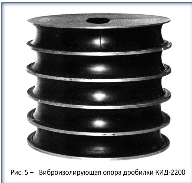
Рис. 5 – Виброизолирующая опора дробилки КИД-2200