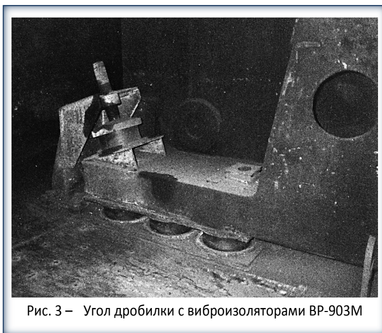
Рис. 3 – Угол дробилки с виброизоляторами ВР-903М

Дробилки ДМРЭ. Виброизоляция молотковых дробилок типа ДМРЭ осуществлялась как на общей раме – ДМРЭ 1000×1000 (ОАО «Днепродзержинский КХЗ») и ДМРЭ 1450×1300 (ОАО «Алчевский КХЗ»), так и в безрамном варианте – ДМРЭ 1450×1300 (ОАО «Запорожжокс»). Для виброизоляции дробилки ДМРЭ 1000×1000 (масса дробилки, электродвигателя, рамы составила 13,9 т; частота вынужденных колебаний – 16,6 Гц) было использовано 10 виброизоляторов типа ВР-903М (статическая жёсткость на сжатие – 1100 кН/м), а для дробилки ДМРЭ 1450×1300 (масса дробилки, двигателя, рамы – 27,0 т; частота вынужденных колебаний – 12,4 Гц) было использовано 15 виброизоляторов типа ВР-903М со статической жёсткостью 1400 кН/м. Для виброизолирующих систем на общей раме упорные виброизоляторы не изменялись.