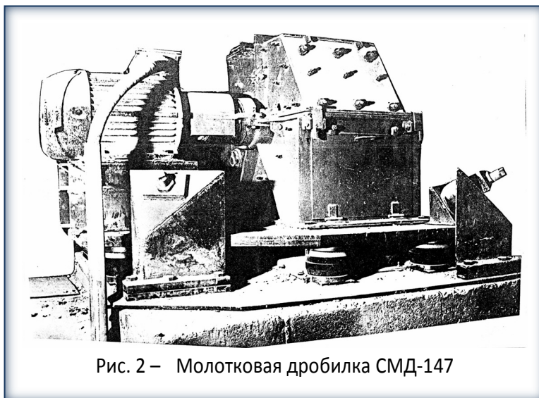
Рис. 2 – Молотковая дробилка СМД-147

Дробилки СМД-147 (п/о «Аммофос», г. Череповец). Молотковые дробилки СМД-147 (масса двигателя и дробилки с материалом 3 т; частота вынужденных колебаний 16,6 Гц) расположены на отметке +8,4 м и значения виброперемещений перекрытия до виброизоляции 0,2 мм со стороны двигателя и 0,66 мм со стороны дробилки. Виброизолирующая система (на общей раме), состоящая из 6 опорных виброизоляторов типа ВР-204 (статическая жёсткость на сжатие – 350 кН/м) и 4 опорных виброизоляторов типа ВР-203 (жёсткость на сжатие 300 кН/м), расположенных наклонно по углам рамы (рис. 2). Расстановка опорных виброизоляторов по сторонам рамы выполнена из условия их равномерного нагружения. После установки дробилки на виброизолирующую систему