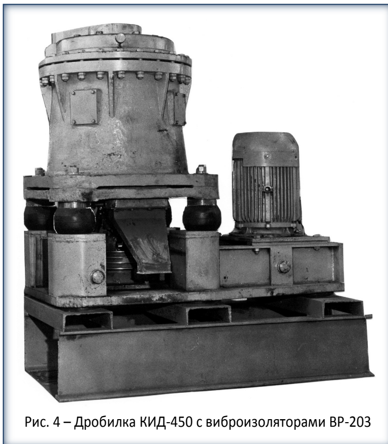
Рис. 4 – Дробилка КИД-450 с виброизоляторами ВР-203

1. Промышленная проверка резиновых и резинометаллических виброизоляторов на различных типах машин показала их высокую эффективность и работоспособность.