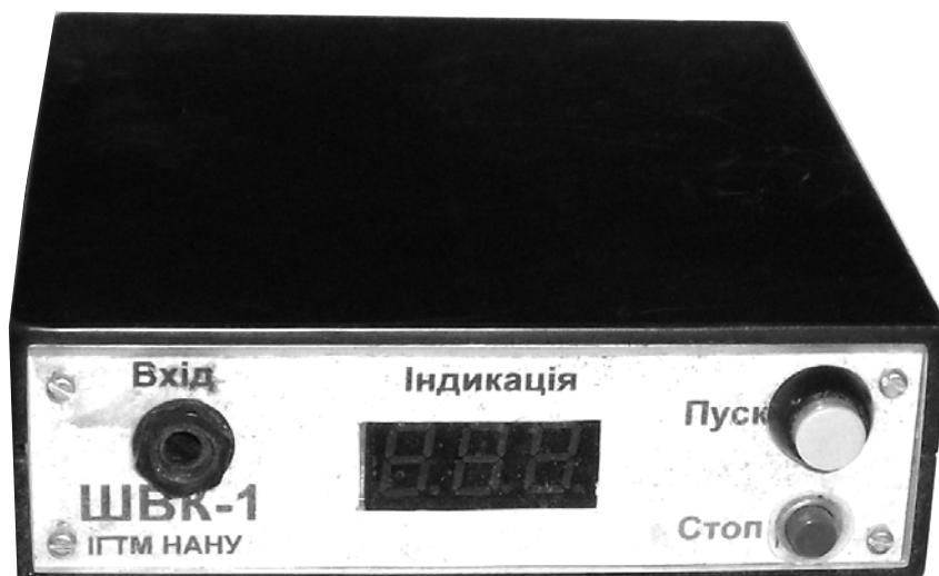
Рисунок 3 – Внешний вид основного электронного блока виброакустического индикатора ШВК-1

Внешний вид основного электронного блока представлен на рис. 3.