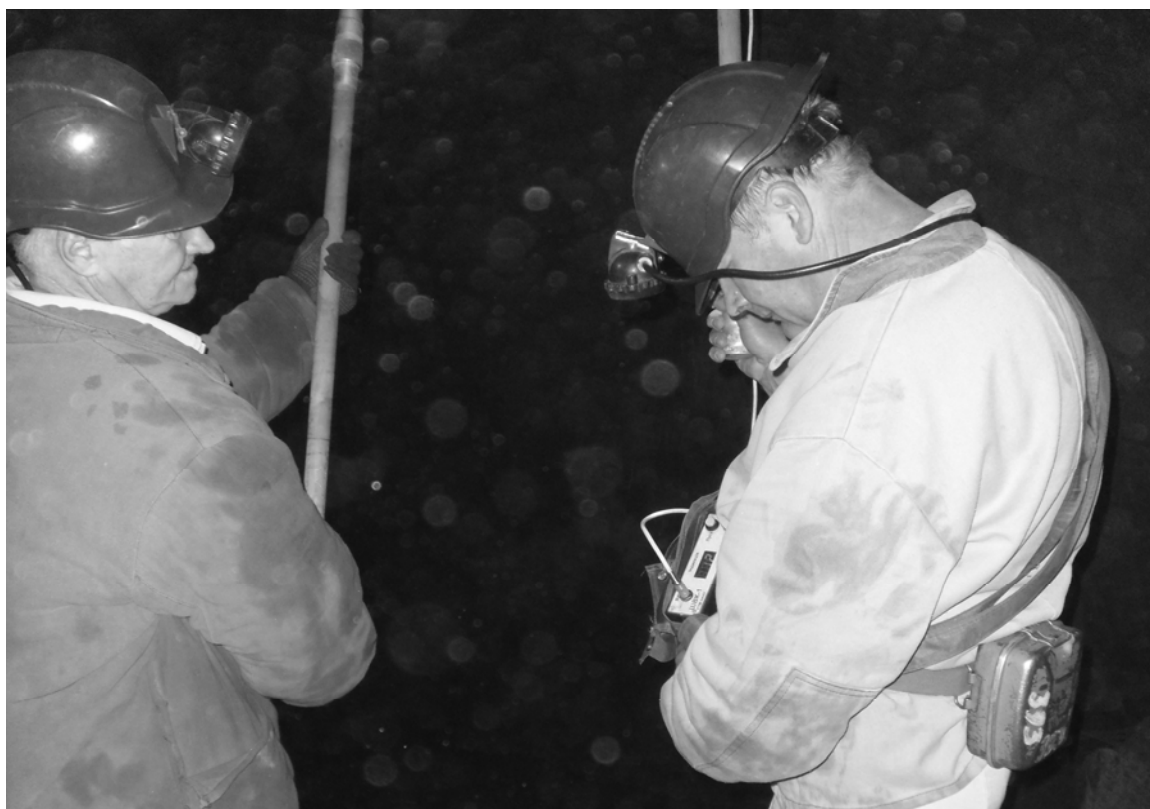
Рисунок 4 – Виброакустическая диагностика кровли незакрепленной капитальной выработки железорудной шахты

Методика обследования участка кровли выработки в условиях шахты «Новая» иллюстрируется рис. 4.