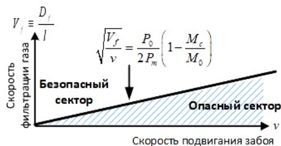
Рисунок 2 – Диаграмма схематического отображения критерия (5)

Таким образом, на основе сопоставления кинетики двух физических процессов, одновременно происходящих при разработке газонасыщенного угольного пласта от горного давления и фильтрации метана через уголь – установлены условия и параметры развязывания спонтанного разрушения призабойного участка газонасыщенного угольного пласта, сопровождаемого внезапным выбросом угля, породы и газа. Установленный критерий даёт возможность выбрать экономически целесообразную и, вместе с тем, безопасную по выбросу скорость отработки пласта с учётом его физико-химических и геотехнологических характеристик.