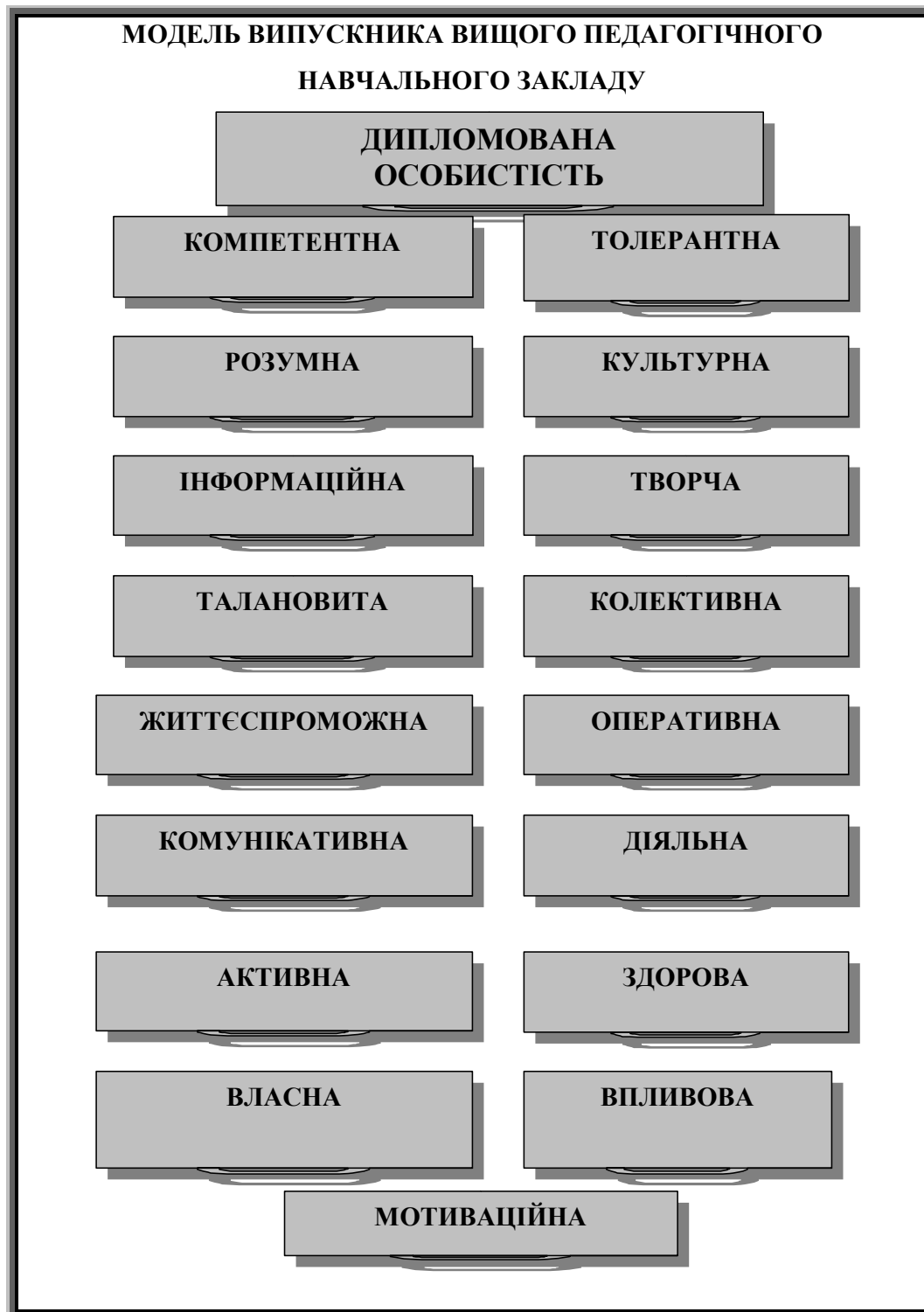
Рис. 3 Модель випускника вищого навчального закладу

Відповідальний педагог повинен гуманно мислити. Сприймати вихованців якими вони є, спрямовувати енергію на продуктивні заняття. Підтримувати, направляти, підбадьорювати, мобілізувати на виконання завдання. Сумлінно виконувати свої обов'язки, надані обіцянки, зобов'язання та мати постійну звичку доводити почату справу до кінця.