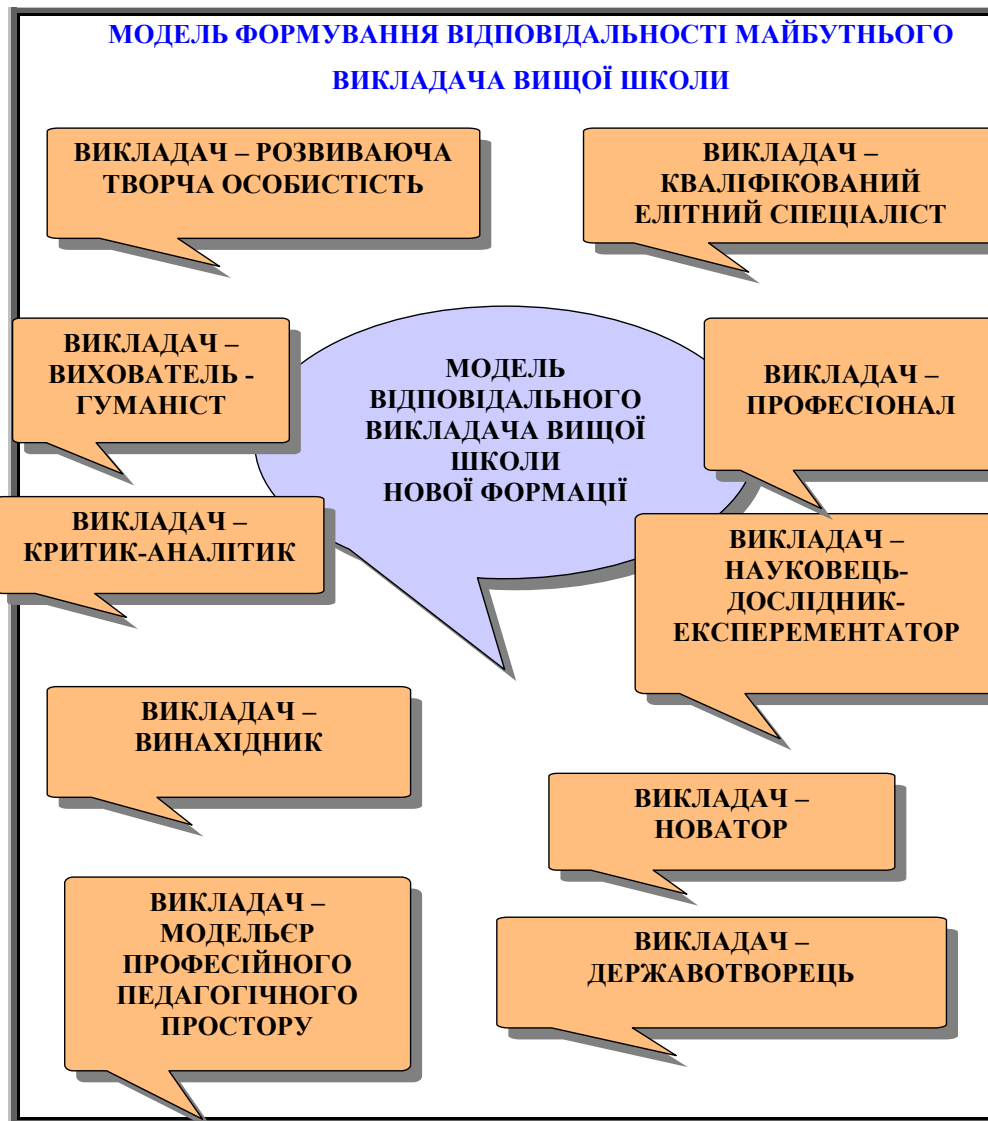
Рис.1 Модель формування відповідальності майбутнього викладача вищої школи

Модель формування відповідальності майбутнього викладача вищої школи має бути: новою; позитивною; рентабельною; прогностичною; пошуковою; перспективною; випереджальною; не стандартизованою; результативною.