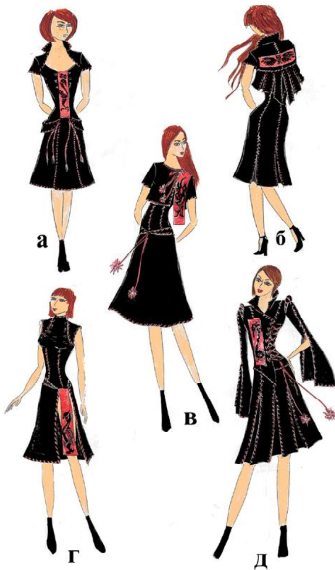
Рис.6. Колекція одягу «Пані-птахи». а - сукня з півнем, б – сукня з совою, в – сукня з голубом, г – сукня з орлом, д - сукня з лебедем