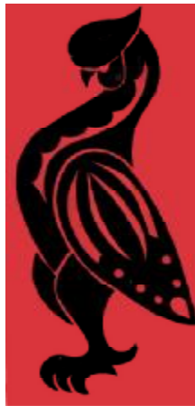
Рис. 4. Орел