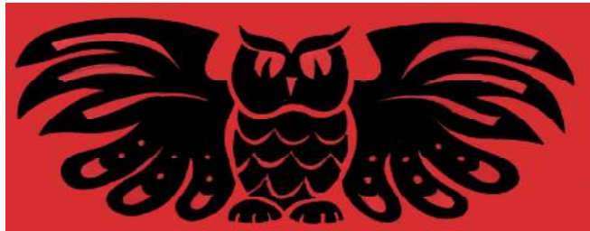
Рис. 2. Сова