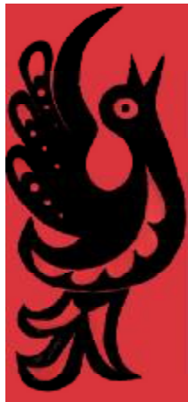
Рис. 3. Голуб