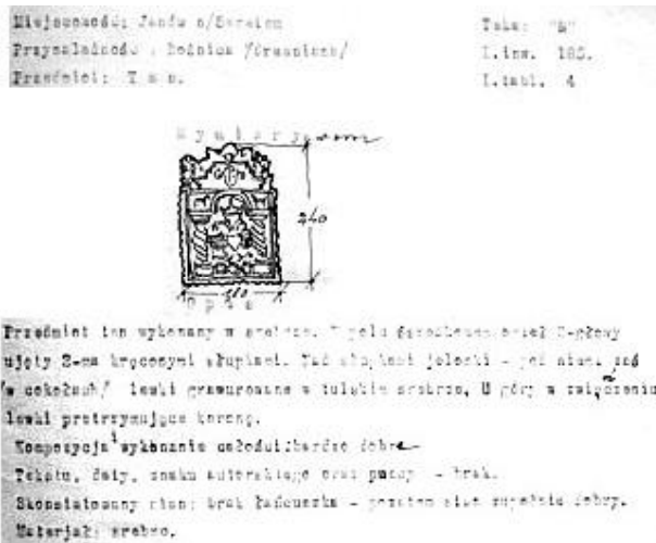
2. Горішній. Янів. Папка "N", інвентаризаційний номер 185