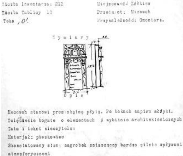
1. Мацева. Жовква. Папка "О", інвентаризаційний номер 212