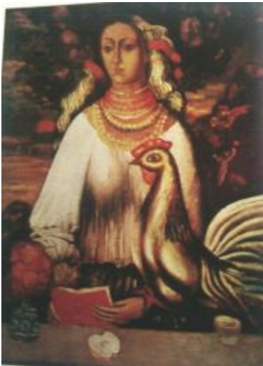
Рис.2. Гуменюк Ф.М. «Вірність Україні», 1972, полотно, олія