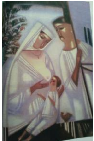
Рис.8. Корнев В.О. «Берегиня», 2001, полотно, олія, 34х29