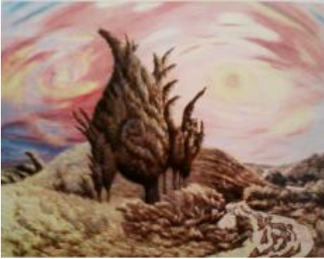
Рис.5. Чернета Г.О. «Неспокійний ранок», 1993, полотно, олія, 85х110