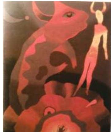
Рис.4. Чегорка О.Т. «Поклик вічності», 1995, папір, гуаш, 19x33