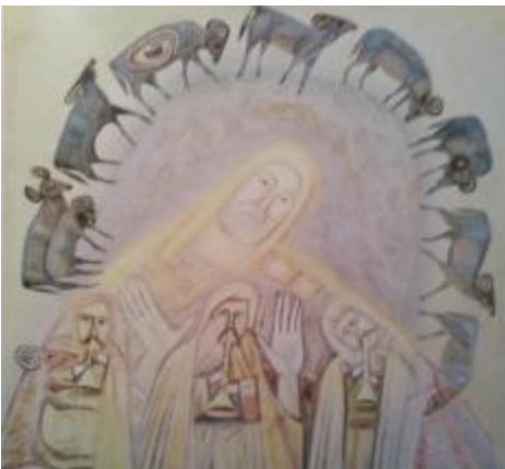
Рис.9. Пушкарьов А.Т. «Предтеча з учнями», 2001, полотно, олія, 65х70