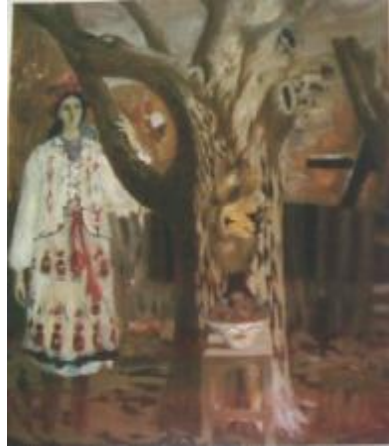
Рис.6. Онищенко А.І. «Роздуми», 1991, полотно, олія, 120х100