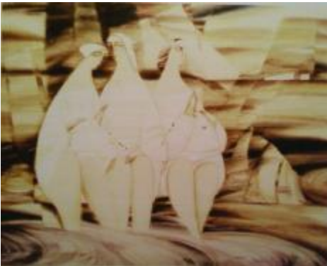
Рис.7. Тафійчук Л.І. «Три кралі», 2002, дерево (ліпа), змішана техніка, 70х80