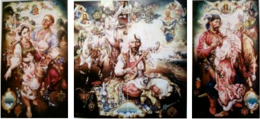
Рис.1. Сопелкін О.Л. «Гімн-молитва», 1998, триптих, полотно, олія, 100x250