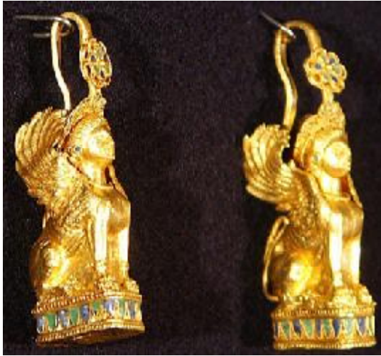
Рис. 1. Серезжки з кургану “Три брати”. С. Огоньки, Автономна республіка Крим, золото, скань, емаль, h – 47 мм, IV ст. до н. е.

майстерність стародавнього ювеліра. Чіткі витончені лінії надають образу виразність і красу. Емалеві вставки синього та зеленого кольорів прекрасно доповнюють скані візерунки на розетці, напаяній на дужку над головою сфінкса, та на п’єдесталі [2, с. 253]. У вухах сфінкса – також емалеві серезжки синього кольору. Цей та інші скіфські ювелірні вироби з використанням емалі мали безпосередній вплив на подальший розвиток українського мистецтва.