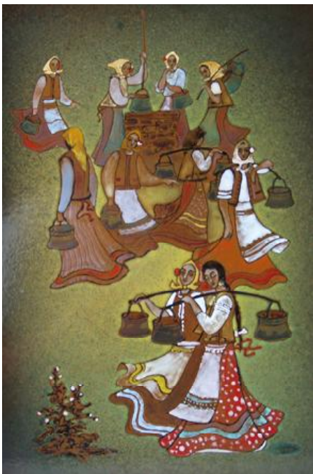
Рис. 5. Чакір Петро. “Біля криниці”. Сталь, емаль, 40х30