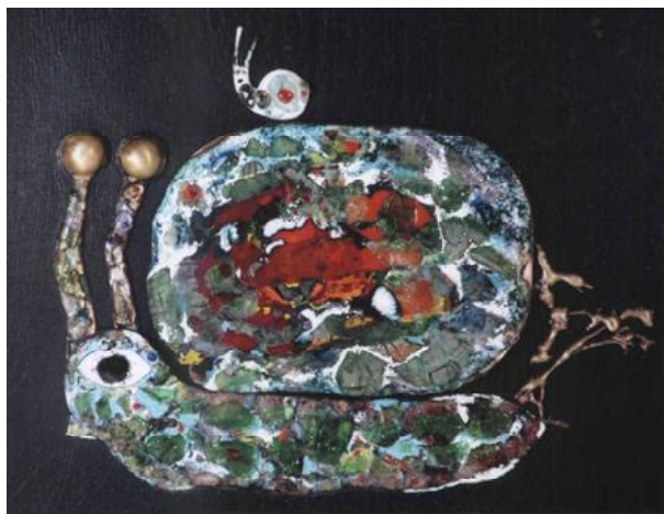
Рис. 3. Княжковська Неллі. "Із дорогоцінним вантажем". Мідь, емаль, мішана техніка, 23x30