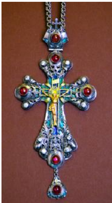
Рис. 4. Пташенчук Микола. “Хрест”. Срібло, золоті вставки, штучне каміння, емаль, 20х9