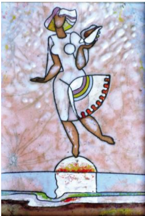
Рис. 2. Косигін Леонід. "Дівчина з мушлею". Мідь, емаль, 1985