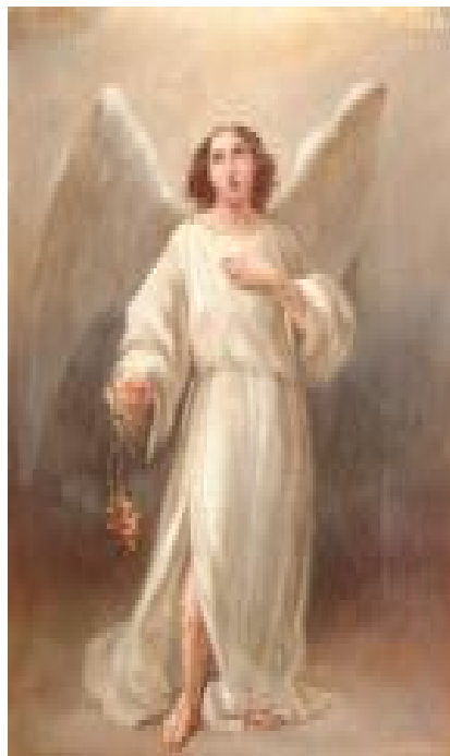
Икона Архангела Гавриила. Служебная дверь слева.

лучах, над Царскими Вратами. Роль боковых служебных дверей иконостаса выполняют двери, ведущие в боковые башни куполов. На левой двери находятся большая икона Архангела Гавриила и две круглые иконы Св. Марии Магдалины и Св. великомученицы Екатерины. На правой двери – икона Архангела Михаила и две круглые иконы Св. Николая и Св. мученицы царицы Александры. На Царских Вратах четыре круглые иконы евангелистов: Матфея, Иоанна, Луки, Марка, но отсутствуют иконы Архангела Гавриила и Девы Марии из традиционной композиции Благовещения. Все иконы выполнены маслом на холсте. Живопись икон характерная для периода классицизма с некоторым влиянием романтизма. Не удалось выяснить имя живописца, написавшего иконы для иконостаса, известно лишь, что алтарные иконы Св. Марии Магдалины и Св. князя Александра Невского написаны Ниссенем. Образы четырех евангелистов на золотом фоне в парусах центрального купола принадлежат кисти Германа Вислененуса (1825-1899 гг.). Он же выполнил роспись императорского дворца в Госларе. Эkleктика экстерьера находит свое продолжение и в интерьере церкви. Классицистические формы иконостаса перекликаются с барочными горельефами херувимов в медальонах на пилястрах.