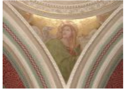
Вислиценус Г. Евангелист Иоанн Богослов. Паруса центрального купола.