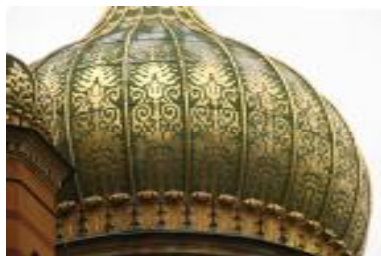
Центральный купол храма Св. Марии Магдалины.