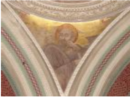
Вислиценус Г. Евангелист Марк. Паруса центрального купола.