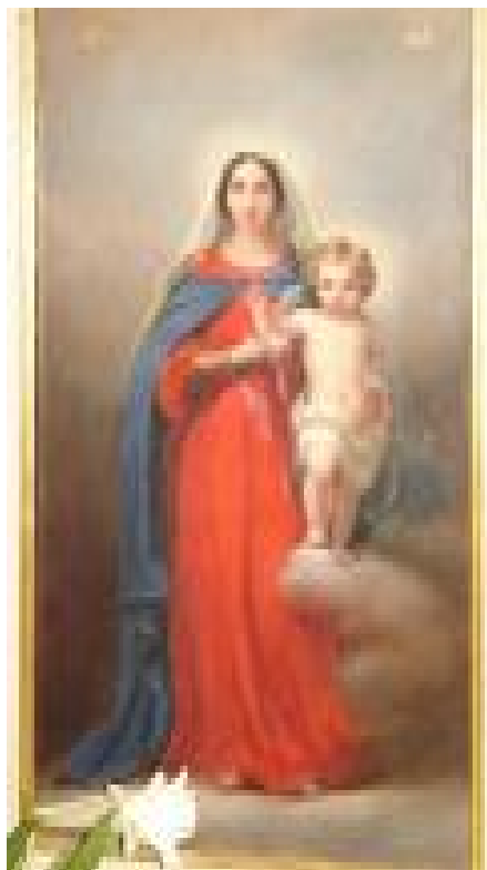
Икона Богоматери с Младенцем. Фрагмент иконостаса.

ордера, по две с каждой стороны. В центре над нишей монограмма Марии Павловны. На стене ниши, где раньше, вероятно, висел ковер, находится четырехчастная кованная ажурная решетка, с изображенными фантастическими существами, каждую часть решетки венчает тонкий ажурный крестик. Небольшое помещение церкви всегда хорошо освещено даже в пасмурный день благодаря четырнадцати витражным окнам двух апсид, большому трехчастному окну с более сложным рисунком витража над входом, круглому витражному окну над нишей и двенадцати окнам основного барабана.