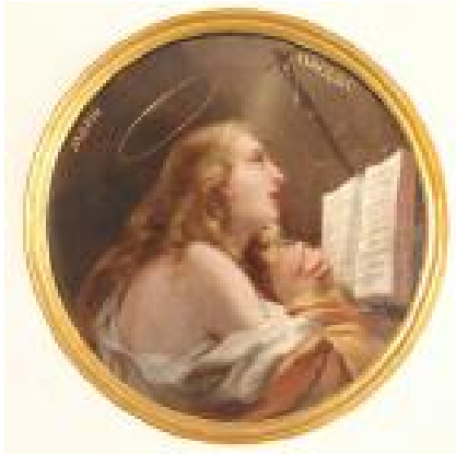
Медальон Св. Марии Магдалины. Служебная дверь слева.