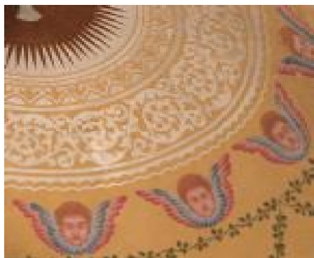
Фрагмент росписи конхи восточной апсиды.