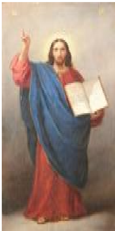
Икона Иисуса Христа. Х., м.