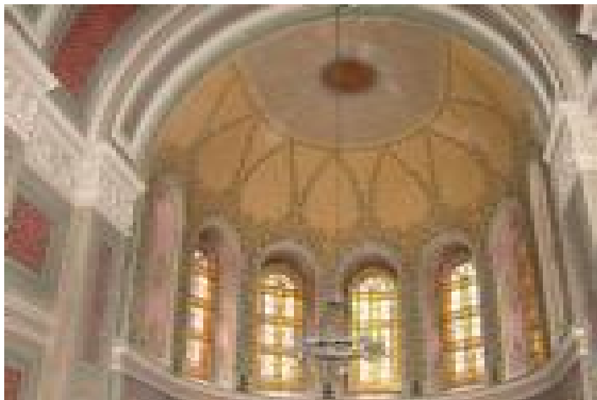
Роспись конхи западной апсиды.