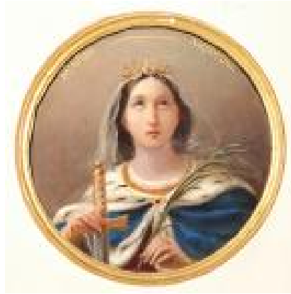
Медальон Св. царицы Александры. Служебная дверь справа.