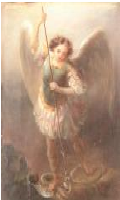
Икона Архангела Михаила. Служебная дверь справа.