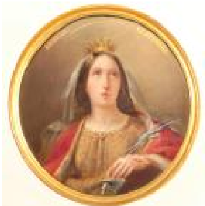
Медальон Св. Екатерины. Служебная дверь слева.