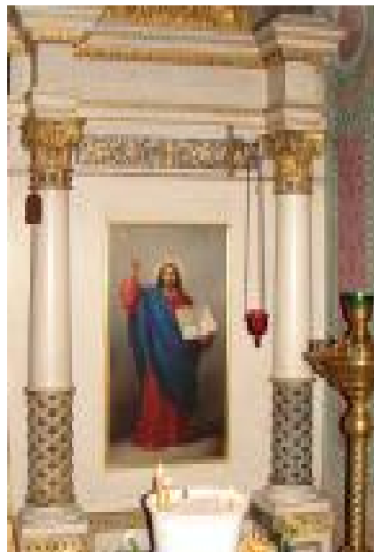
Икона Иисуса Христа. Фрагмент иконостаса.