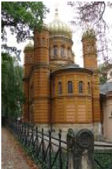
Храм Св. Марии Магдалины на Историческом кладбище в Веймаре. Вид на восточный фасад*.