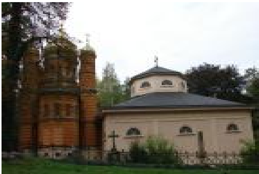
Храм Св. Марии Магдалины и усыпальница Веймарских герцогов.