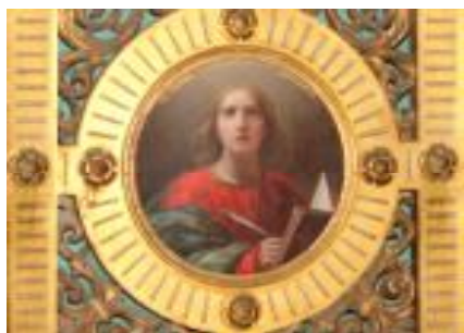
Евангелист Иоанн Богослов из Царских Врат. X., м.