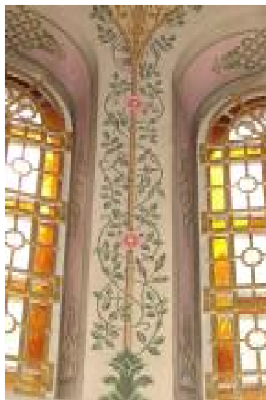
Фрагмент росписи простенка апсиды.