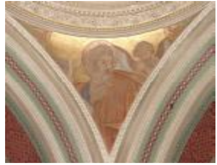
Вислиценус Г. Евангелист Матфей. Паруса центрального купола.

Определенно это реализм, но нарушение пропорций и фигур, и ликов, неуверенность постановки глаз и лепки формы отдают некоторым любительством. Из них наиболее убедительно выполнен образ евангелиста Иоанна Богослова. В целом росписи смотрятся несколько грубовато по сравнению с тонкой живописью образов иконостаса. Но маловероятно, что великий герцог мог пригласить для росписей храма дилетанта, тем более, что Вислиценус расписывал императорский дворец. Можно предположить, что позже могло быть выполнено неквалифицированное “подновление” образов или что-то было утрачено в результате осыпей красочного слоя, а общие тоновые краски в местах утрат смазывают впечатление о первоначальном рисунке и живописи, но это только предположение и сейчас ничего нельзя сказать с полной определенностью. В целом, совокупность всех вышеупомянутых факторов, веющих “милой провинциальностью”, оставляет очень теплое ощущение при посещении этого замечательного храма.