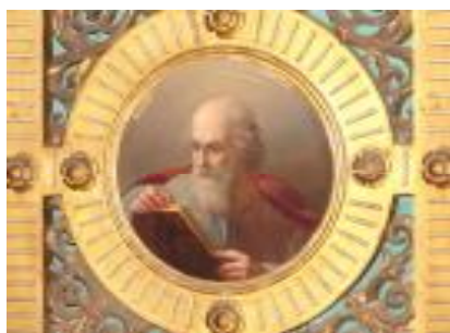
Евангелист Марк из Царских Врат. X., м.

оштукатуренных стен достигается за счет характерной для византийского стиля равномерного сочетания горизонтальной окраски охрой красной и охрой золотистой. Зеленые купола полностью покрыты золотым орнаментом и опоясаны позолоченным фризом из листьев аканта, что не совсем свойственно русской церковной архитектуре, а скорее придает некоторый ориентальный оттенок и пышность. Высокие восьмигранные четырехъярусные боковые барабаны, которые фактически являются пристроенными к основному зданию башнями, с небольшими луковичными куполами больше напоминают минареты. Вместе с традиционным большим центральным барабаном, это усиливает эклектический характер здания, дополненный мавританскими элементами. Единственный вход в церковь находится не с западной, как обычно, а с южной стороны и обрамлен скромным портиком в романском стиле, на котором, под розеткой с крестом, высечена дата окончания строительства – 1862 г. Сильно вытянутый вверх общий силуэт церкви с практически одинаковыми по высоте пятью куполами своей архитектурой напоминает стоящие рядом свечи, что подчеркивает мемориальный характер сооружения.