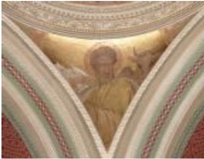
Вислиценус Г. Евангелист Лука. Паруса центрального купола.