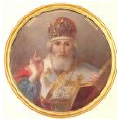
Медальон Св. Николая. Служебная дверь справа.

Декоративную живопись стен можно разделить на три вида: традиционный древнерусский переплетающийся узор в арках и на пилястрах, ориентальные мотивы в орнаменте на стене западной апсиды, создающие за счет мелкого горизонтального модуля ощущение плетения ковра, и орнамент в виде растительных и цветочных гирлянд и “хороводов” херувимов на сводах апсид. Такие переплетения из листьев и цветов также были характерны для росписей и в жилых интерьерах периода классицизма. Лик Иисуса Христа в своде центрального барабана окружен кольцом из херувимов. Говорить о стиле живописи образов евангелистов и лика Христа сейчас трудно.