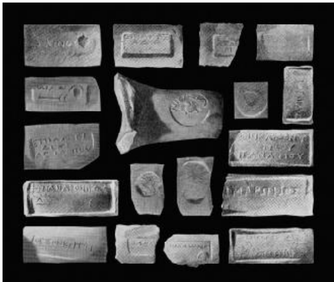
Фото №7 Клейма из Родоса.

Амфорное производство Фасоса IV-III столетий сопровождалось практикой систематического магистратского клеймения. Энглическое (с выступающим рельефом) клеймение было Фасосу хорошо известно, хотя и не было для него характерным на протяжении всей практики магистратского контроля, охватывающей полтора столетия. Эта традиция была установлена в Гераклее, в Амастрии и в виде исключения – в Синопе. [15, с.27, 38]