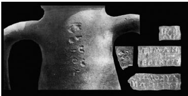
Фото №3 Клейма гераклейских амфор

горлышко, ручку, реже – ножку амфоры до ее просушки и обжига, что свидетельствовало о тиражном изготовлении. Чаще всего оттиск был произведен вдавливанием знака, но в некоторых случаях рельеф был выпуклым и выполнялся пресс-формой. Культура авторского клейма стала известна с 7-6 вв. до н. э. [11, с. 643]. На художественных изделиях в Древней Греции авторскую принадлежность удостоверяла не знаковая монограмма, а короткая фраза типа: «Меня исполнил Фидий», «Сделал Пракситель» или «Эту статую сделал Мирон... или Полимед». Копию никто не имел права подписывать. На дорогих изделиях чернолаковой и краснолаковой посуды мог подписаться только общепризнанный мастер росписи, а не автор-изготовитель керамического черепка.