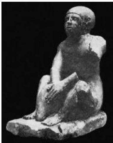
Фото №9 Статуэтка работника, запечатывающего сосуд. Египет, 3-2 тыс. до н.э.

Изменения в структуре причерноморской торговли в конце эпохи эллинизма привели в традиционные производственные центры новых торговых контрагентов. С этого рубежа, новая маркетинговая политика принципиально изменила морфологию керамической тары, прекратила систематическое клеймение амфор, ввела унификацию тарных сосудов по римским образцам. И хотя некоторые греческие центры традиционного виноделия и виноторговли (Родос, Книд, Кос) продолжали вывоз вина на причерноморские рынки, греческое амфорное производство из оригинального и самобытного явления превратилось в подобие итальянских образцов. [19, с.67]