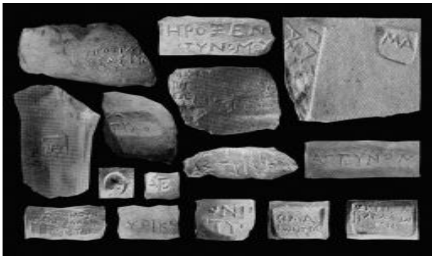
Фото №8 Клейма из Херсонеса.

В Гераклее уже в раннем эллинизме было установлено систематическое клеймение [14, с.22-53]. Клейма в одну и две строки, как правило, содержали имена фабрикантов, и такая практика продержалась приблизительно с 415 г. до н.э. до середины 90-х годов IV века до н. э. [25, с.45] На сегодняшний день известны имена примерно 50 фабрикантов, отнесенных к краннефабрикантской группе (РФГ). В дальнейшем, на протяжении IV века, амфорное производство в Гераклее осуществлялось под магистратским контролем, – в легенде клейма наряду с именем фабриканта фигурировало имя магистрата. [Фото 3]