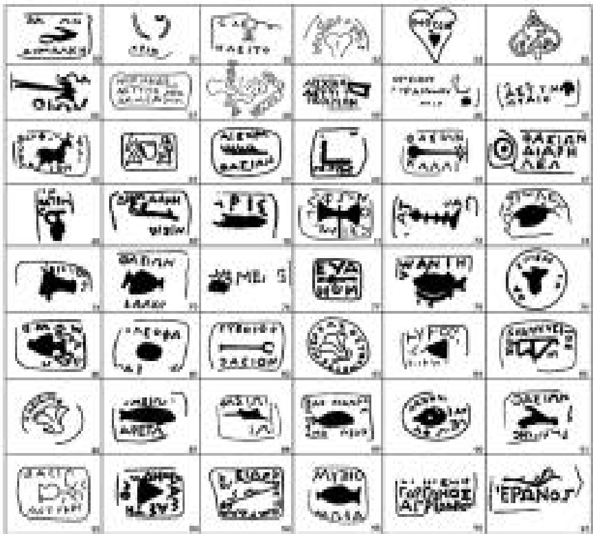
Таблица №3 Комбинирование аналогов «фирменных знаков» и логотипов.

С VII по II века до н.э. на греческой амфорной продукции своим клеймением зарегистрировалось более 280 фабрикантов и магистратов.