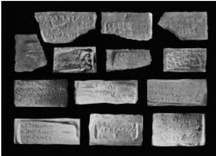
Фото №6 Клейма из Синопы.

Производство о. Фасос разнообразных сортов вина требовало выпуска сосудов не только разных фракций, но и нескольких типо-стандартов. Тарные амфоры на Фасосе выпускались с конца VI и вплоть до середины - начала третьей четверти III столетия до н.э. [9, с.39]. Существовала определенная специализация в производстве различных типо-стандартов и разной