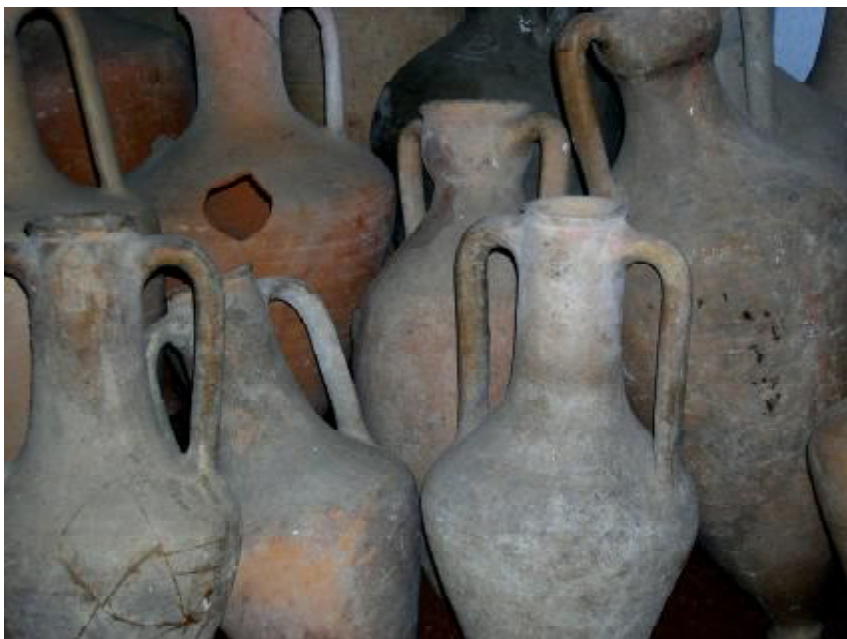
Фото№1 Амфоры в музее заповедника г. Ольвии

С VII-VI вв. до н.э. в городах Северного Причерноморья налачился импорт вина и масла из таких средиземноморских центров как: Фасос, Хиос, Родос, Менды, Милет, Клазомены, Лесбос, Кос, Пепарет, Парос, Икос, Книд, Эгина, Синопа, Халхидика и др. [18; 29; 30], (Табл. 2). При вхождении Причерноморья в общую экономическую систему Римской империи поток вина и оливкового масла, как основной статьи товарооборота, шел из южно-понтийских центров. Широкого размаха греко-варварская торговля в Северном Причерноморье достигла в IV в. до н.э. В ее орбиту включились территории от Дуная на западе – до Дона и Волги на востоке. Если до IV в. до н.э. в ареал экспорта-импорта входили преимущественно лесостепные племена Среднего Приднепровья [20,с 25], племена Нижнего Прикубанья и, отчасти, Нижнего Дона, то после в него были задействованы кочевники причерноморских степей. Античные города Северного Причерноморья: Тира, Ольвия, Херсонес. Пантикапей, Фанагория и Горгиппия выступали посредниками в торговле с варварским миром. Основной статьей импорта было вино. [20, с.47]