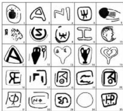
Таблица №1 Аналогия «фирменных знаков».

с указанием года, места производства, цвета и наличия сладких добавок. Пробка и ярлычок клеймились по воску непосредственными производителями вина, а также магистратами, инспекторами и гарантом продукта. Клеймо было своеобразным знаком качества изделия, этикеткой, накладной и кассовым чеком одновременно. Если амфора была не достаточно обожжена и протекла, клеймо указывало адрес для предъявляемых претензий. По клейму брак обменивался на новую продукцию. Технически клеймо выполнялось печатным способом (штемпелеванием), вдавливаясь в