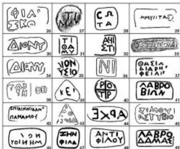
Табл. №2 Аналогия «мокрых печатей» или штампов.