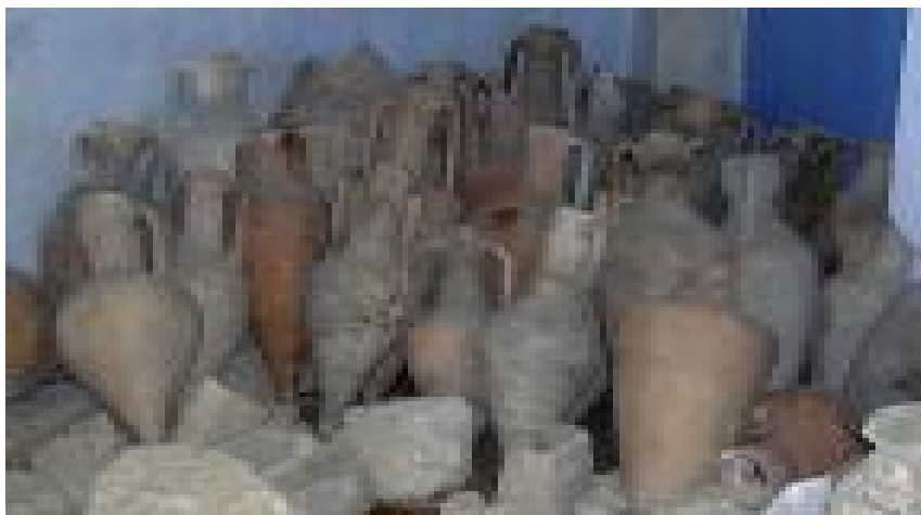
Фото.№2 Амфоры заповедника г. Ольвии из затонувшей части города.

В античности культивировалось до 150 сортов винограда, приспособленного к различным почвам и климатическим зонам. Экспорт вина из Римской империи простирался от Скандинавии до Индии. Перебродившее в погребах в течение 5-10 лет вино помещалось в амфоры. Цвет амфорной тары, ее форма и клеймо характеризовали ввозимый продукт и выражали: вкусовые особенности, гарантии качества, место производства, имя поручителя за качество изготовления самой упаковки. Такое же клеймо при «бутилировке» и укупорке ставилось на запечатываемую воском или глиной пробку. Это гарантировало целостность разлива, сохранность продукта, обеспечивало герметичность упаковки. Каждая амфора снабжалась ярлычком