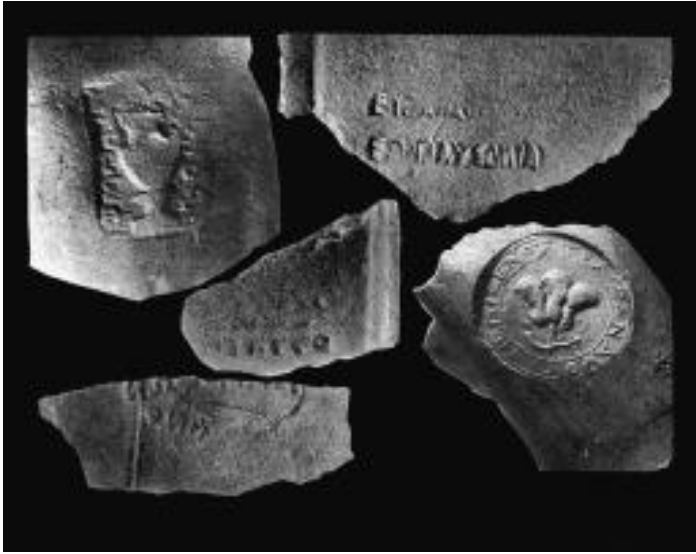
Фото №5 Клейма из Родоса, Фасоса, Гераклеи .