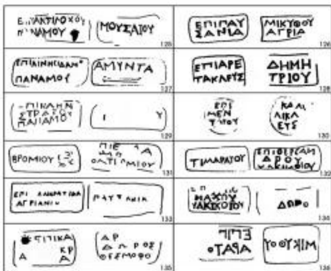
Таблица №5 Аналогия двойных «мокрых печатей» или штампов. Клейма магистратов и фабрикантов.

Широкая известность и значение фасосского вина, находившего сбыт у населения Поднестровья, Приднепровья, Крыма, Нижнего Дона и Прикубанья, нашло отражение в целом ряде нарративных и эпиграфических источников, в том числе в появлении около 480 года до н.э. первого закона «о вине и уксусе».