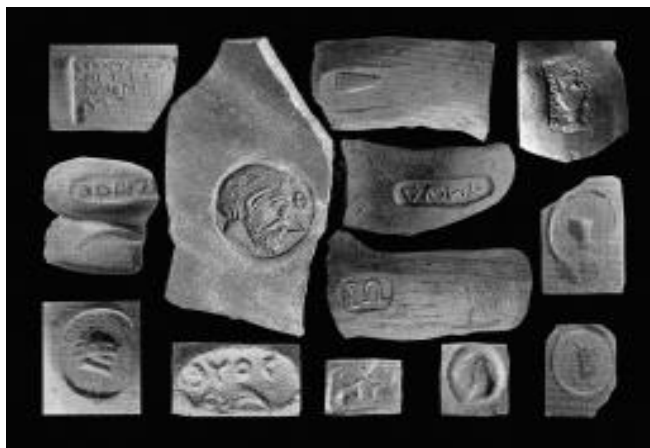
Фото №4 Клейма Книда, Коса, Фанагории, Фасоса.

Со 2-й пол. V в. до н.э. такие мастерские, как эргастерии можно считать организованными мануфактурными производствами. С помощью рабов, вольноотпущенников, а также вольнонаемных рабочих при разделении труда и числе работников до 50 человек эргастерии добивались более высоких производственных показателей, чем частные мастерские. Государство или крупные предприниматели предоставляли работнику (рабу) за соответствующее вознаграждение помещение, инструменты, оборудование, сырье, давая ему возможность самостоятельно вести хозяйство. [11, с.643]