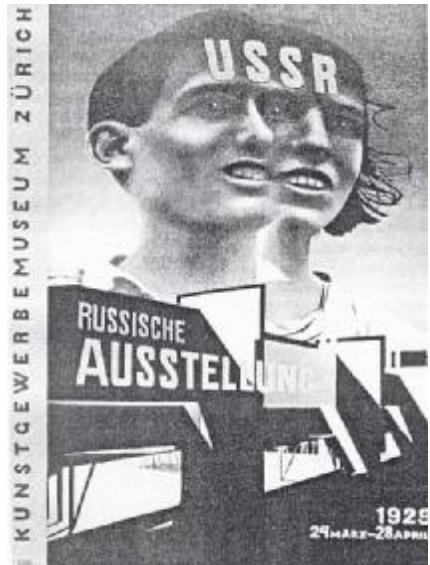
Л. Лисицький. Плакат для «Русской выставки» в Цюриху (1929) [II.8].

Коло інтересів іншого видатного діяча мистецтва того часу Л. Лисицького також охоплювала фотографія, фотомонтаж та виготовлення фотограм. Одним з найкращих творів такого роду можна назвати плакат для «Русской выставки» в Цюриху.