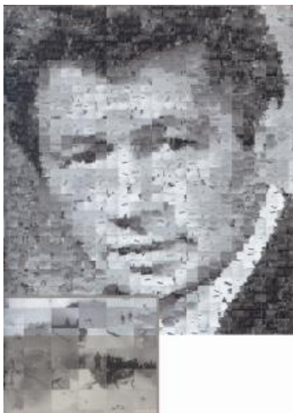
Ігор Дудник. Портрет режисера та актора Леоніда Бикова, викладений кадрами з його фільму «В бой идут одни старики» [П.6].

Отже, за весь час свого еволюційного розвитку, фотографія набула багато змін. Вона залишилася лише як назва однієї з технологій кінцевого відображення, як метод зйомки об'єкту. За принципом отримання інформації мало що змінилося: сучасна «камера Обскура» перетворилася в оптичний об'єктив, стали іншими лише методи запису потоку світла в кінцеву інформацію. Корінним