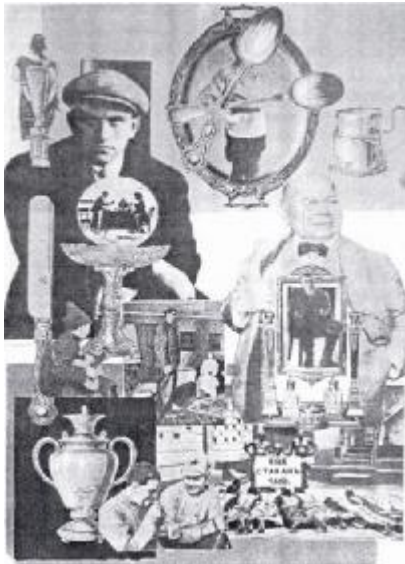
М. Родченко. «И это стоит столетья...» Ілюстрація до поеми В.Маяковського. 1923р [II.3].

Дуже важливі та цікаві для радянської поліграфії і роботи майстра в області фотоколажу, робота з оформлення книг та журналів, де він часто працював разом з В.Степановою – радянською художницею та дизайнером [II.2].