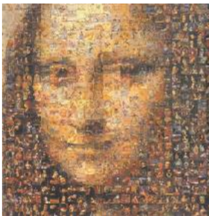
Роберт Сільверс. Мона Ліза, викладена шедеврами живопису [П.6].

В рамках цієї роботи хочеться відзначити сучасну техніку роботи з фотографічним зображенням, появу якої зумовили передові технології - фотомозаїки (створення мозаїчних портретів з маленьких фотографій). Однією з перших мозаїк, створених за допомогою комп'ютера, є робота Дейва Маккена, що була зроблена в 1994 році за допомогою програми «Photoshop». У 1995 році американський студент-програміст Роберт Сільверс пише комп'ютерну програму, що дозволяє створювати мозаїчні зображення, складені з тисячі маленьких зображень. Замовниками мозаїк стають такі компанії як Audi, Coca-Cola, Microsoft та інші. Починаючи з 1999 року український дизайнер Ігор Дудник працює над створенням технології виробництва фотомозаїки. На сьогоднішній день якісну фотомозаїку спроможні створити всього декілька дизайнерів у світі [П.6].