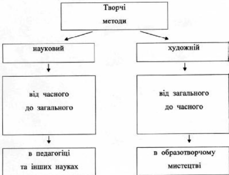
Таблиця 2. Основні принципи творчих методів.

Завдання :об'єднати через дидактику ці 2 методи.