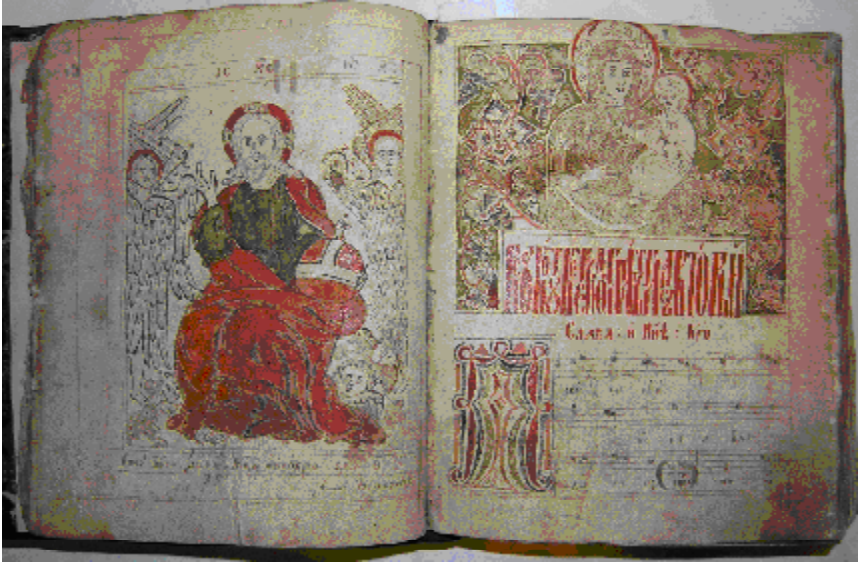
Аркуш № 4 з Ірмологіону 1794 – 1795 рр. Посторінкова мініатюра зліва та півсторінкова справа