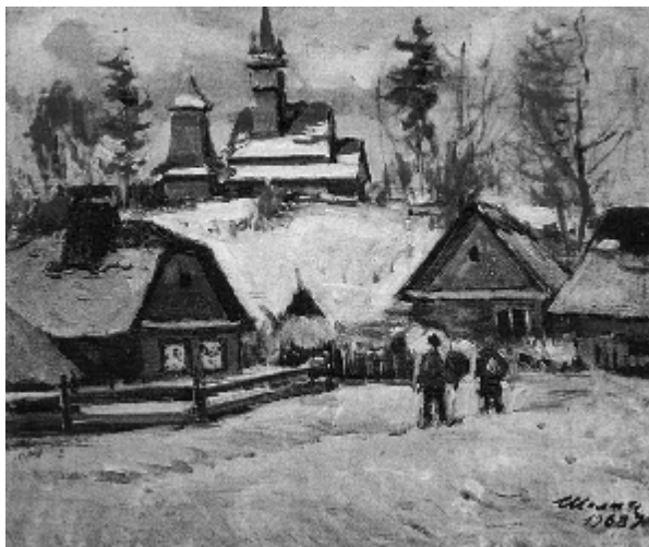
Рис. 4. «Зима» (1968)