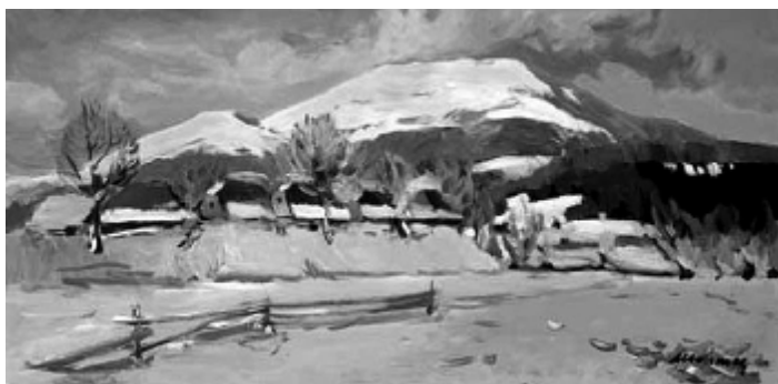
Рис. 6. «Зимовий пейзаж» (1970)