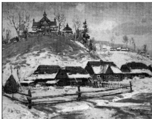
Рис. 3. «Струківська церква» (1971)