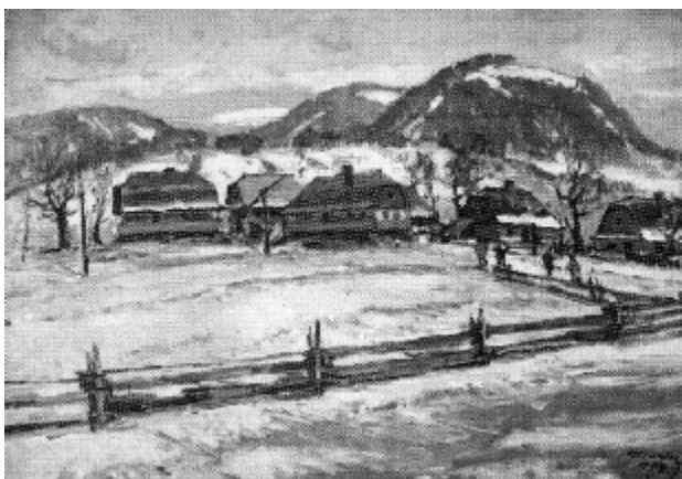
Рис. 2. «Зима в ставному» (1979)