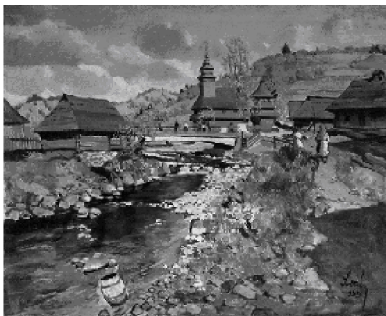
Рис. 5. «Над річкою» (1939)