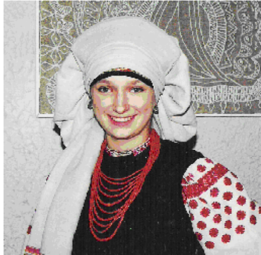
Рис. 7. Студентка, вбрана в реконструйований традиційний костюм з елементів одягу Черкаського регіону із фондів ЧКМ.