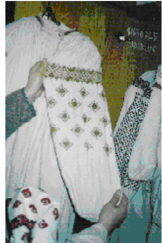
Рис. 1-6. Зразки оздоблення традиційною для Черкаського регіону вишивкою жіночих сорочок з фондів Черкаського краєзнавчого музею (ЧКМ).