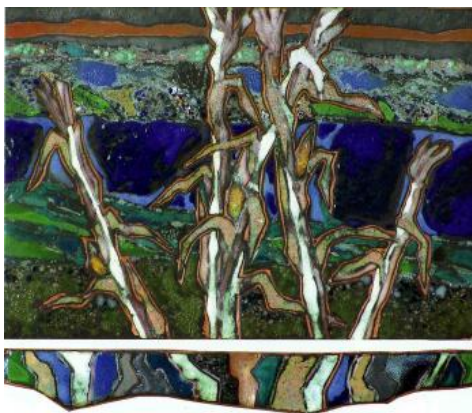
Ю. Бородай. Полтавський пейзаж. Ріка. 65x70. Мідь, емаль. 1998