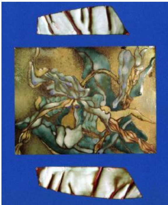
Ю. Бородай. Орхідея. 50x80. Мідь, емаль. 1998