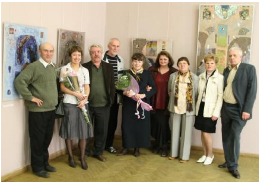
Мистецька родина Бородайв. 2008