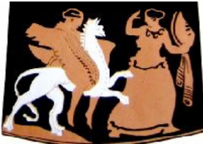
Рис. 2. Дионис-Аполлон преследующий верхом на грифоне менаду. Роспись пелики IV в. до н.э. Эрмитаж.