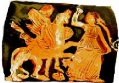
Рис. 3. Дионис-Аполлон преследующий верхом на грифоне менаду. Роспись пелики IV в. до н.э. Эрмитаж.