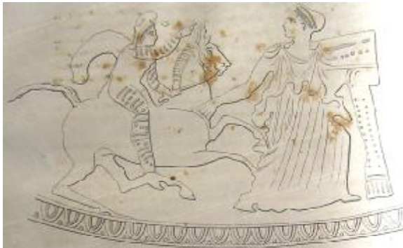
Рис. 4. Всадник (Восточный человек) преследующий менаду. Роспись боспорской пелики IV в. до н.э. Эрмитаж.