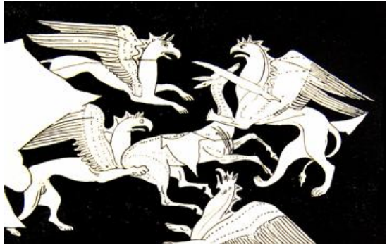
Рис. 9. Грифоны терзающие лань (душу). Роспись боспорской вазы IV вв. до н.э. Эрмитаж.