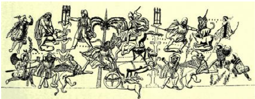
Рис. 11. Так называемая «персидская охота». Прорисовка с арибаллического лекифа мастера Ксенофонта. IV в. до н.э. Эрмитаж.