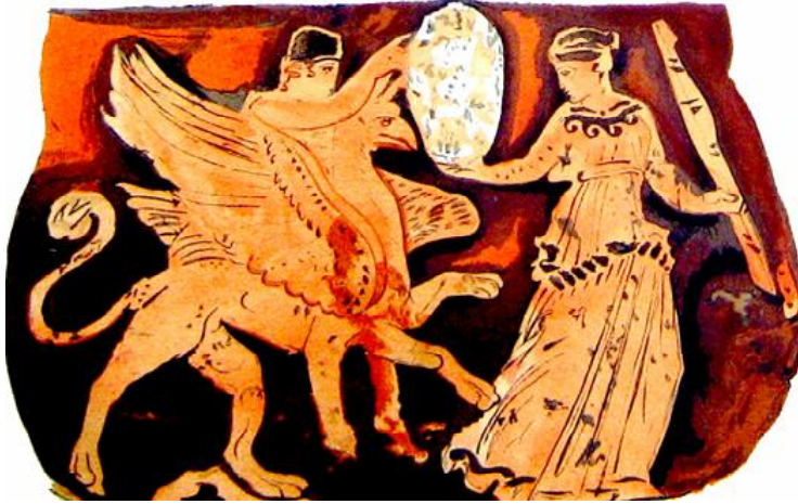
Рис. 1. Дионис-Аполлон преследующий верхом на грифоне менаду. Роспись пелики IV в. до н.э. Эрмитаж.