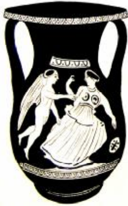
Рис. 8. Эрот настигший менаду. Роспись боспорской пелики IV вв. до н.э. Эрмитаж.