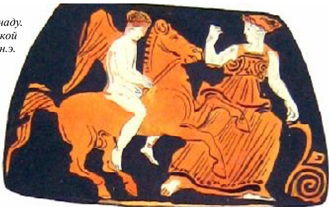
Рис. 5. Эрот преследующий менаду. Роспись боспорской пелики IV вв. до н.э. Эрмитаж.