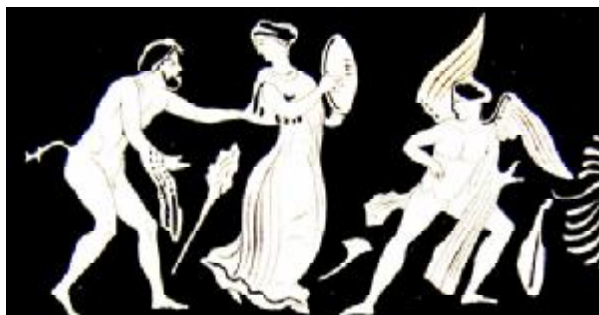
Рис. 6. Сатурн, помогающий Эроту увлечь за собой менаду. Роспись боспорской пелики IV вв. до н.э. Эрмитаж.