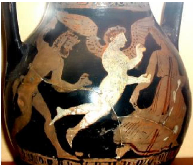
Рис. 7. Эрот «плывущий человек» нагоняющий менаду. Роспись боспорской пелики IV вв. до н.э. ОАМ.